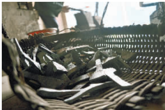
地上的箩筐里放着一堆待完成的小刀片。来店订货的人很多,排上一个月的队是常有的事。