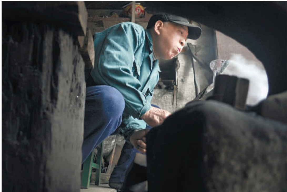
何文斌入赘后,先是参加合作社做铁器,到了1976年,他偷偷在自家一楼不临街的地方打铁。主要是打菜刀,把捞刀河闻名的打菜刀手艺带进了长沙城。