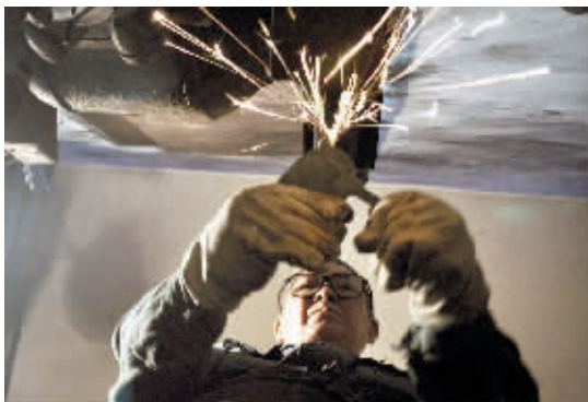
对于每件产品,何师傅都会细心打磨到最完美。