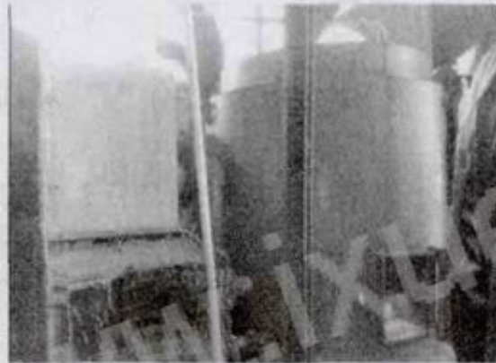
侧视图 图左为锅炉图右为燃烧机