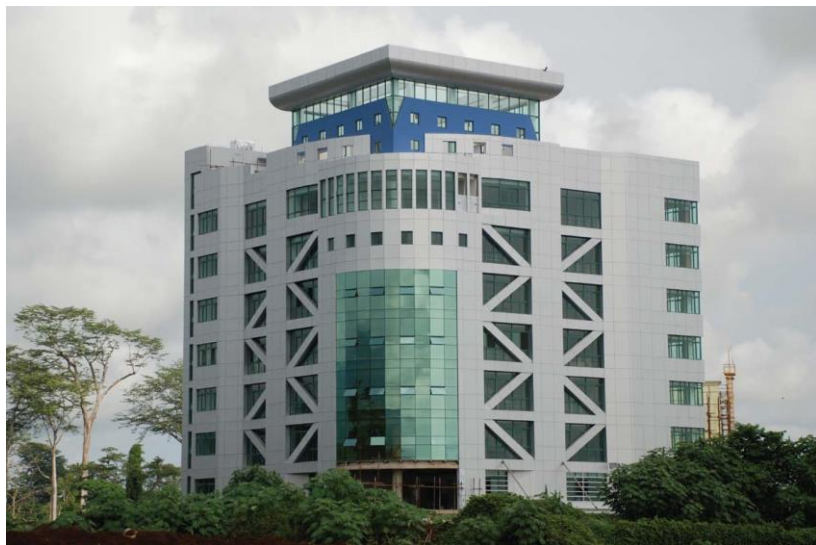
赤几总理府办公楼