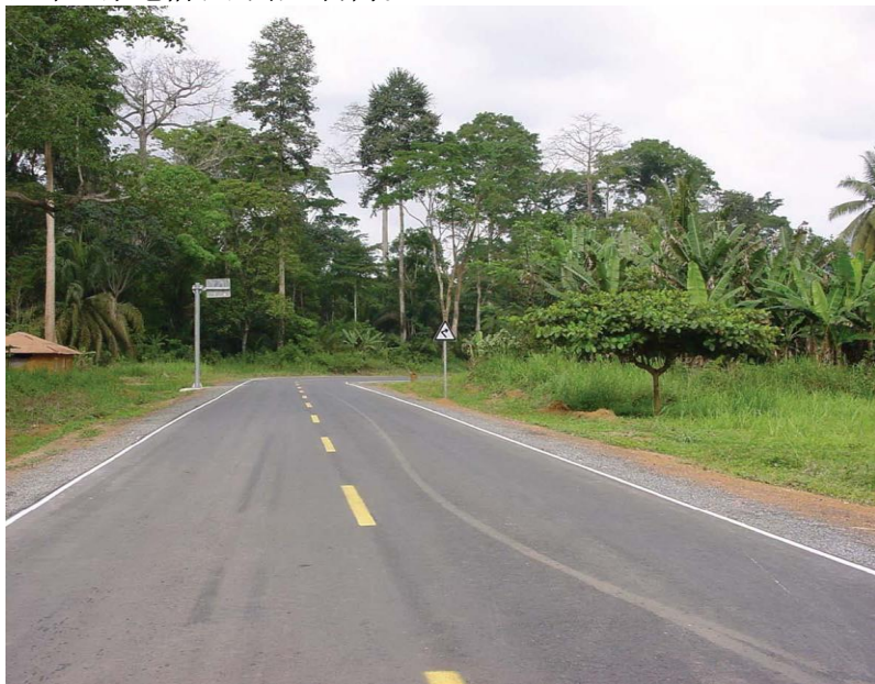
中国援赤几涅方-恩圭公路路段

项目情况：已完成赤几国家安全网络建设、赤几非盟会议中心地区通讯网的建设和非洲杯足球赛体育场通讯网络建设。2011年新签赤几全国光传播骨干网的建设项目，并于2013年完工。2012年2月1日，由中兴通讯公司与赤几政府合资成立的赤几通讯公司（GECOMSA）正式营业，这也是赤几第三家电信和网络运营商。