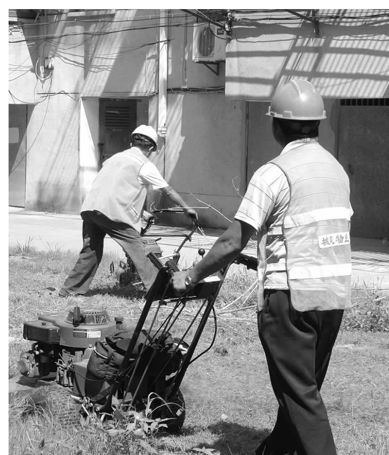
近日,市城建物业公司加大对管辖小区的整治力度,抓紧修剪草坪、疏通排污管道、清运暴露垃圾,巩固小区双创成果。

为此笔者建议,凡是公路沿线非公路标识的各种宣传广告牌,公路、交通、城管等主管部门都应联手加以整治,及时给以全部取缔,确保公路环境整洁美观、公路标识突出鲜明、道路交通井然有序。