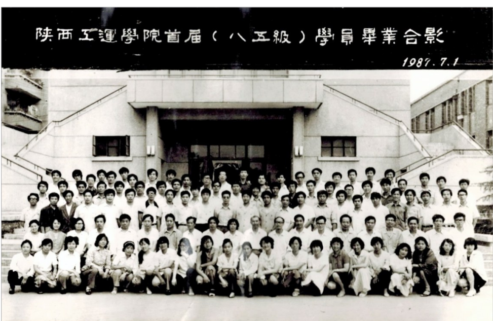
陕西工运学院首届(八五级)学员毕业合影 1987.7.1