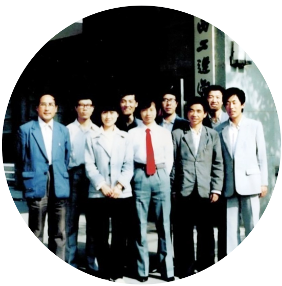
当年同班小组学员在学院门前留影

1980年7月30日凌晨,关麟征病危送香港伊利沙白医院,医生护士在抢救过程中发现他胸前伤痕累累,甚为惊讶。关夫人介绍说:“这些伤痕都是他抗日浴血奋战所伤。”在场的医护人员和亲友深受感动。1980年8月1日,关麟征逝世。举殡之日,黄埔军校各期留港学生及亲友数百人执绋。徐向前元帅向关麟征在香港的家属发唁电云:“噩耗传来,至为悲痛,黄埔同窗,怀念不已,特此致唁,诸希节哀。” □汪运渠