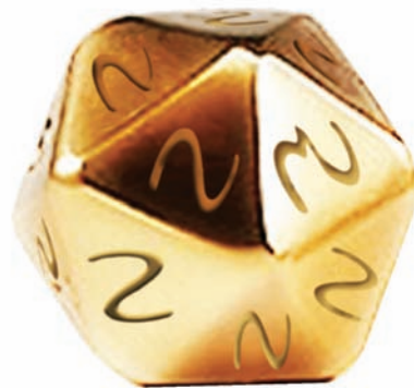
图 2. 仅有一面带有“毛刺”的多面色子

在本例中，即是一个 50000 个面的色子，您可以借助图 2 中的色子想象一下，出现异常波形的那一面向上的几率。因此仅一次采集就可捕获毛刺的几率是 1/50000，而无法捕获毛刺的几率是 49999/50000。