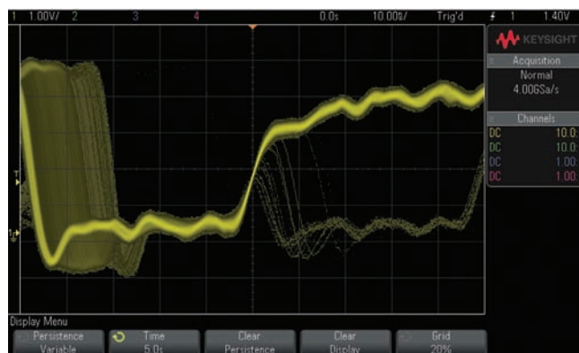
图 3. 当捕获率为每秒钟 1,000,000 个波形时，Keysight MSO/DSO3000 X 系列示波器可靠地捕获偶发亚稳状态。