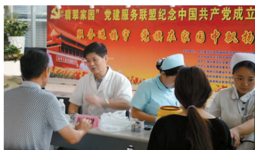
举行“服务进楼宇，党旗在风中飘扬”活动。

以“五个我来”主题活动为载体，将党建工作精准、有机地融入“经济发展、和谐关系、家园治理、公益服务、文明风尚”等五大主题，引领楼宇治理，实现楼宇党建与辖区党建、区域化党建等“连点成线”。区楼宇党建联盟各成员单位积极参与文明城区创建、企业助推乡村治理、“圆梦行动在贤城”等活动，引导楼宇党组织和党员主动融入社区、奉献社会。