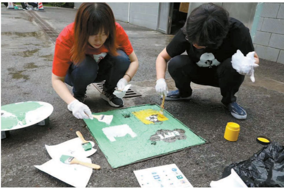
今年4月，白领和党员化身“兼职美化师”在漕河泾开发区里开展环保彩绘。

在区域党建促进会虹梅分会、“虹梅庭”企业社会责任联盟和园区楼宇联合会平台的推动下，各大园区、企业都拿出实际行动