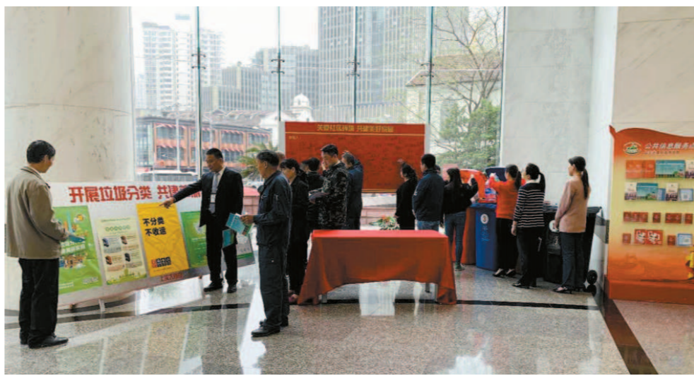
上实大厦变废为宝垃圾分类宣传展。

联合党支部联合举办了“垃圾分类，人人参与”宣传活动，白领们依次领取了《上海市生活垃圾全程分类宣传指导手册》，现场还开展了模拟操作，将收集的垃圾投放到不同的垃圾箱内，学习垃圾分类小知识。