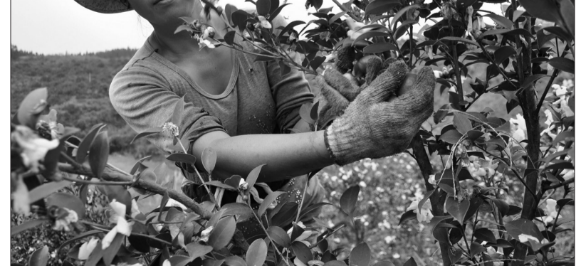
贵州省黎平县近年来大力发展农业特色产业,大规模实施特色油茶种植,使其逐步成长为当地农民增收的主导产业。目前,全县种植的茶园23.4万亩,油茶再获丰收,年产值达3亿元,解决当地近5万群众就业。图为当地群众在高屯油茶种植基地采收油茶籽。

今年第一至第三季度,很多投资都是疲软的,但农业投资增长率高于26%,尤其是农村旅游业方面的投资增长得更快。可以说“三农”的很多领域还是投资的洼地,今后怎么样能把财政的资金利用好,提高它的使用效率,能够调动社会资金、金融资本投向“三农”,这是一篇大文章。