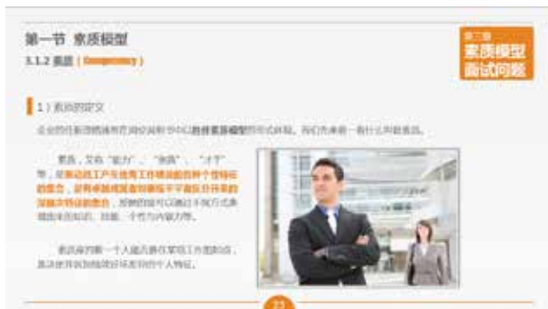
图 3-79 简洁式标题

标题的设计分为简洁式标题，简洁大方，基本没有修饰；点缀式标题，此种标题应用较多，简单的修饰让标题栏既不花哨也不单调；最后是背景式标题，此类标题以色块作为背景，时尚流行，几种标题的样式如图 3-79～图 3-81 所示。