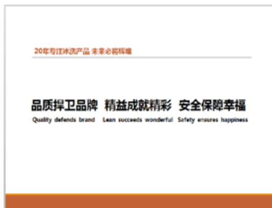
图 3-31 结束页 1

如果想要将 PPT 在网络上共享又不想失去版权，可以在结束页对版权的处理做一下说明。以下是几种常见的结束页设计版式。