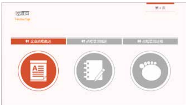
图 3-29 目录式过渡页

用目录页作为过渡页，可以通过颜色区别显示讲过的内容和马上要讲的内容。即用不同颜色显示不同内容。用目录页作为过渡页，可以让观众随时知道演讲的进程，讲过了多少，还要讲哪些内容，可以为接下来讲的标题设置动画效果，增强观众的视觉冲击力，提高观众的兴趣，如图 3-29 所示。