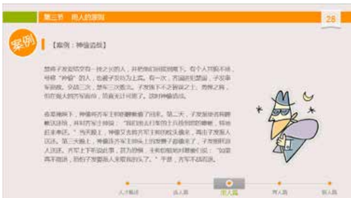
图 3-73 小图作点缀

◇ 小图重点缀：小图作为点缀形式存在，并不占用太多页面，可以不抢眼，主要作用是突出文字或其他模块的表现力，如图 3-73 所示。