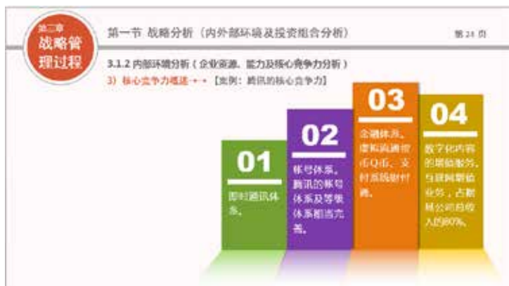
图 3-15 有节奏感的画面

也要运用明暗对比手段，显示出构图的主体部分和陪衬部分的正确关系。也可以同时运用多种明暗对比因素的构图形式去处理复杂的题材，表现重大的主题，如图 3-15 所示就是采用明暗对比的效果。