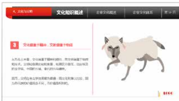
图 3-7 图片元素与主题无关

PPT 中的一切对象都必须与当前主题相关联，或衬托主题、或点明主题，但是不可在其中加入与主题无关的元素，否则会有画蛇添足之嫌，从图 3-7 和图 3-8 中对图片元素的添加可以看出，一个与主题密切相关的图片是非常重要的。