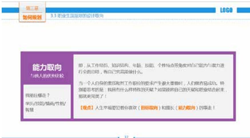
图 3-57 叠加加强逻辑效果

将不同的色块进行叠加，可以加强版块之间的逻辑效果，如图 3-57 所示的页面，将两个色块叠加到下面的大色块之上，两层叠加的边缘也起到了一个边框的作用，整体感觉更加协调统一。