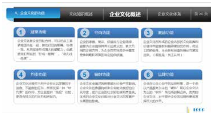
图 3-46 使用框分割模块

框在 PPT 中的应用主要体现在它的模块化，使页面形成一个或多个模块，实线框和虚线框，以及框线的粗细都会影响到 PPT 的整体设计感。图 3-46 中用框分割模块，显得整洁有序。