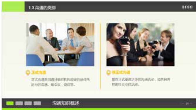
图 3-77 对称式排版