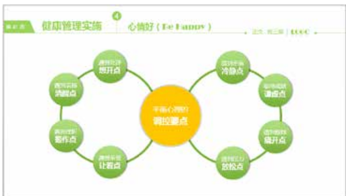
图 3-14 对比统一的画面

协调是近似的关系，对比是差异的关系。对比要通过画面中各因素的倾向性和近似的关系来获得协调感。以协调与统一占优势的构图，也必定要处理某些变化的因素，使整个画面不致单调而有生动感，如图 3-14 所示。