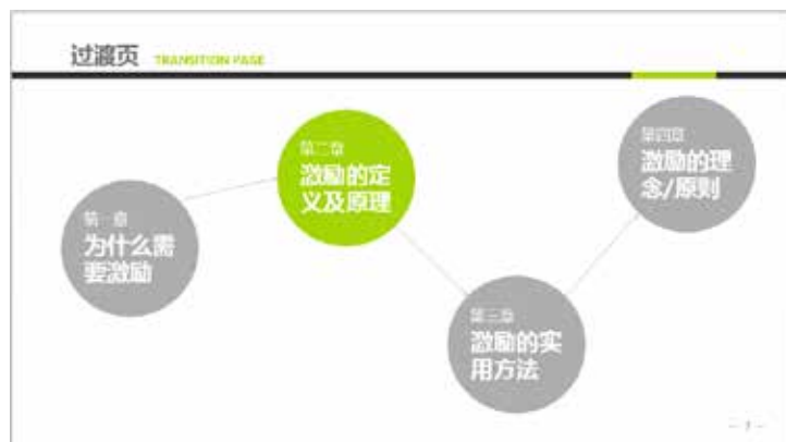
图 3-55 独特的过渡页

如图 3-55 所示的过渡页面，就是通过不同的色块，直观地体现出即将要演示的内容，同时也可以让观众了解到后面还有哪些内容。