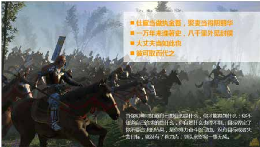
图 3-56 和图片的层次搭配

对于将整幅图片作为背景的 PPT 来讲，使用色块并将色块处理成透明的效果，既能起到分割区域的作用，又能保持整幅图片的完整性，可以让页面更具有层次感，如图 3-56 所示。