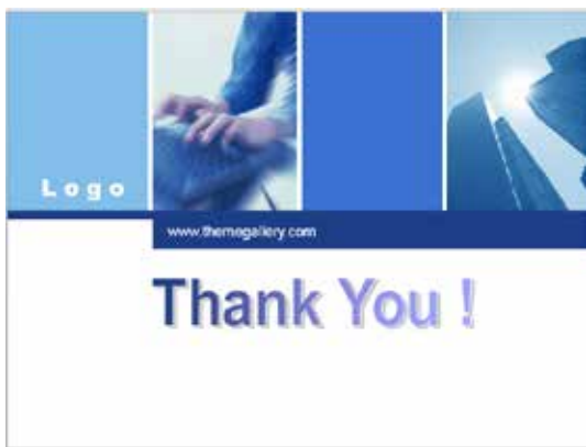
图 3-32 结束页 2