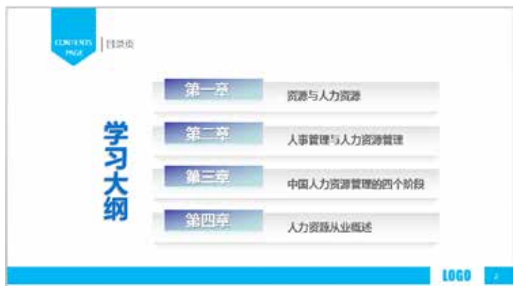
图 3-16 重复构成目录图表

在制作 PPT 的目录、流程、关系型等图形的过程中，经常会不断地使用同一个形状来构造画面，这种相同的形象出现两次或两次以上的构成方式叫做重复构成。基本形重复后，其上下、左右都会相互连接，从而形成相似而又有变化的图形。多种多样的构成形式生成千变万化的形象，使得画面丰富且具有韵律感，如图 3-16 和图 3-17 所示。