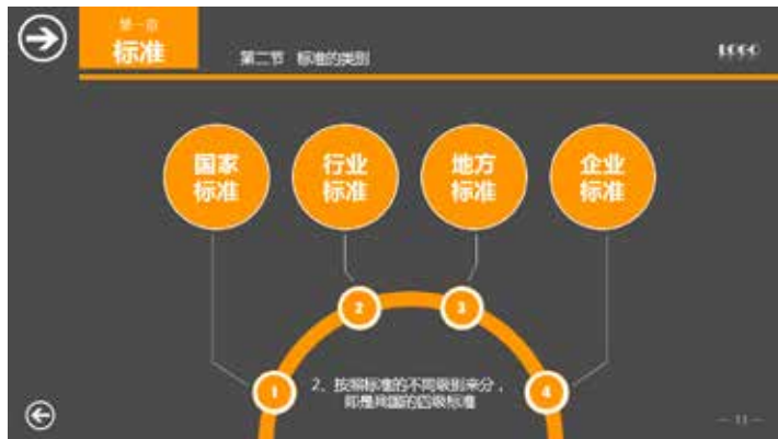
图 3-45 线应用于图表