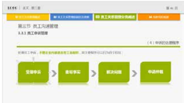
图 3-62 对角圆形矩形的应用

此图形与矩形相比有两处平滑流畅的边缘，显得更流畅顺滑，增强 PPT 的设计感。图 3-62 和图 3-63 是该图形和矩形的对比效果。