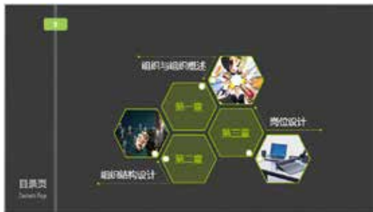
图 3-26 目录页 3