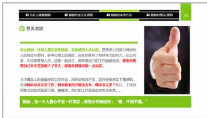
图 3-54 色块展示观点、点缀

如图 3-54 中的最后一行，把“观点”内容单独使用一个背景色块框起来，不仅可以起到点缀页面的作用，同时也会起到吸引读者注意力的目的。