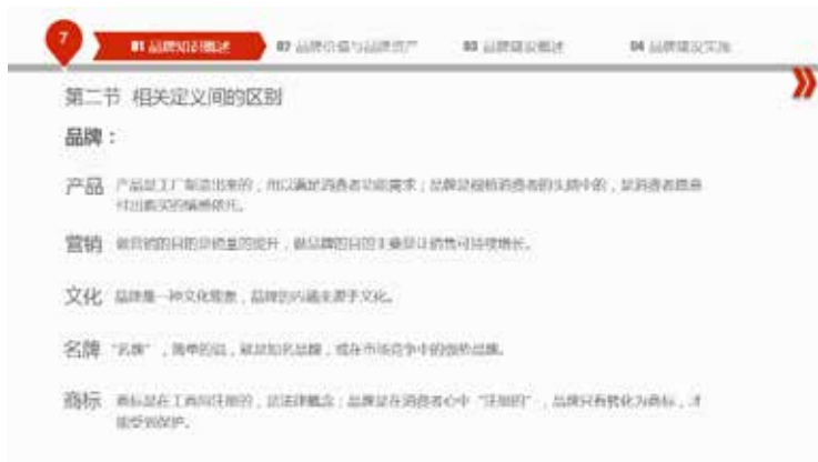
图 3-71 内容呈段落编排

最后，文字的图表处理也是文字的一种表现形式，使整个 PPT 设计感更强烈，也更便于观众记住 PPT 的内容。使用图形图表对文字内容进行形象化的处理，观众可能在几年后还会对该内容记忆犹新。如图 3-71 和图 3-72 所示，后者明显比前者更便于观众记忆。