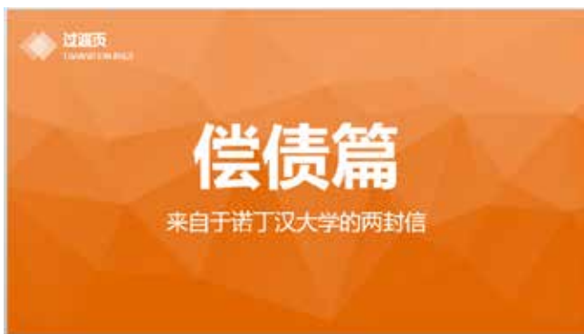
图 3-28 全屏过渡页

过渡页用一幅满屏的图或背景点缀标题文字，此页面信息量不同于其他页面，信息量较少，如图 3-28 所示。