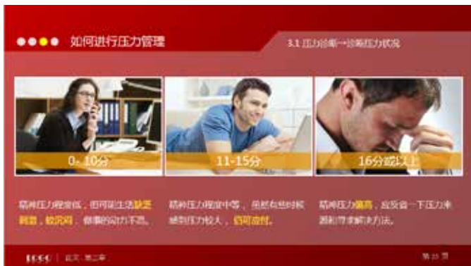
图 3-78 多图布局排列

多图的排版方式讲究布局排列之美，页面上每增加一张图片，版面就会更活跃一些，图片增加到三张或以上，就能营造出很热闹的版面氛围。根据版面的内容来精心安排，效果会非常突出，如图 3-78 所示。