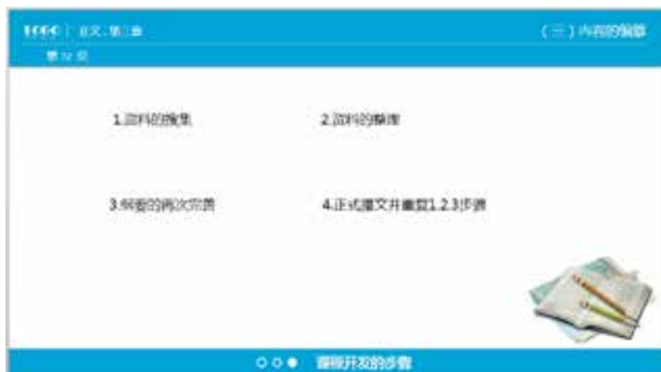
图 3-9 组成元素分散

PPT 内各组成元素应保持密切的联系，否则会导致相互关系表达混乱，无法传达出想要表达的主题，从图 3-9 和图 3-10 两幅图的对比中可以看出，