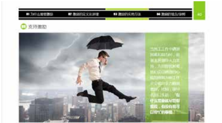
图 3-75 大图重冲击力

◇ 大图重冲击力：图片的视觉冲击力比文字强，所以大图少字的排版方式常用于 PPT 的制作，除了图片有记录和信息交流的功能外，艺术渲染是大图排版的最显著的特点，如图 3-75 所示。