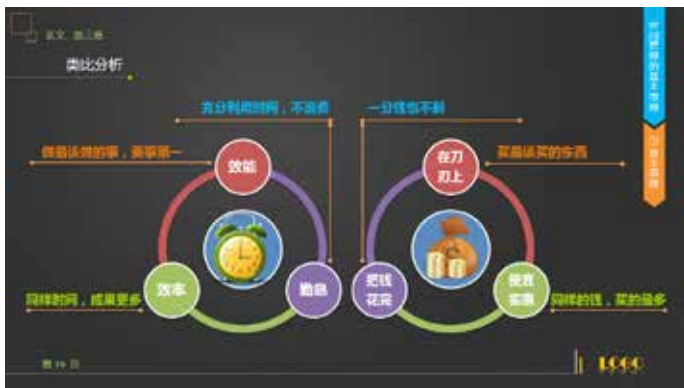
图 3-37 图表文本左右对称

在日常生活和艺术作品中，“对称”常代表着某种平衡、和谐之意。PPT 所讲究的对称一般指模块的左右对称和上下对称。把比重相同的内容以对称的方式排列，在某种程度上给读者传递一种元素间的相互对比、比重平衡的信息，如图 3-37 和图 3-38 所示。