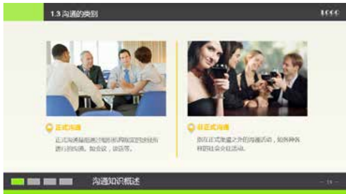
图 3-44 线应用于对称模块