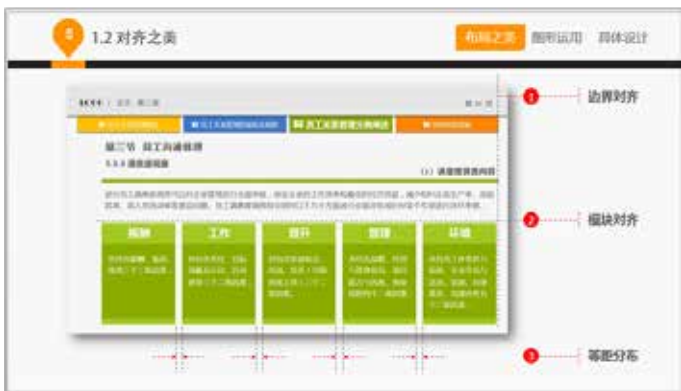
图 3-35 图形对齐排列

自古有“不以规矩，不能成方圆”的俗语，在 PPT 的制作当中，边界、模块的上下左右对齐，会使 PPT 更规整。如图 3-35 所示，图中各元素右侧相对于边界对齐，五个文本框相互对齐，等距离分布，在视觉会有比较舒服的感觉，而如果这五个文本框排列杂乱无章，会让观众产生厌倦感。