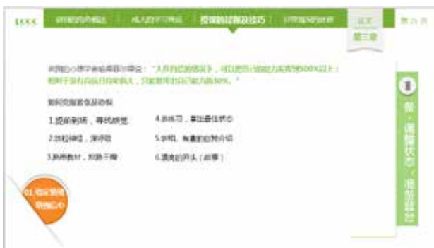
图 3-11 主题内容不突出

在组织元素表达中心内容时，应当合理安排各元素之间的相互关系，利用文字的艺术效果、图片的调整、图形的特殊效果等将重点内容突出显示，如图 3-11 和图 3-12 两幅图的对比中，后者采用几何图形将几个选项依次排列在一个正六边形周围，不仅突出了主题，同时也使得画面更具动感，更好地吸引受众的眼球。