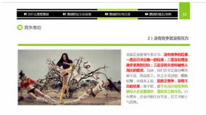
图 3-74 中图重排版美

◇ 中图重排版美：中等图形，大小适中，更便于页面的排版与对齐，而且图片在视觉传达上用于辅助文字，帮助理解，如图 3-74 所示。