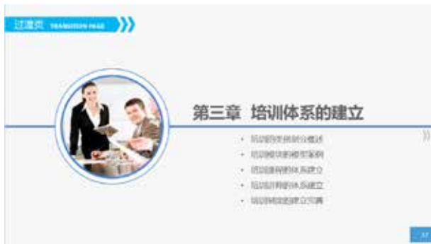
图 3-58 应用于标题栏和边角

此图形可以作为“箭头”的变体，起到指向的作用，但要比“箭头”表现的意境更委婉。还可以在标题栏或边角作为点缀的图案，加上颜色的搭配，使整个页面活跃起来。如图 3-58 和图 3-59 所示。