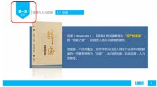
图 3-65 五边形的应用