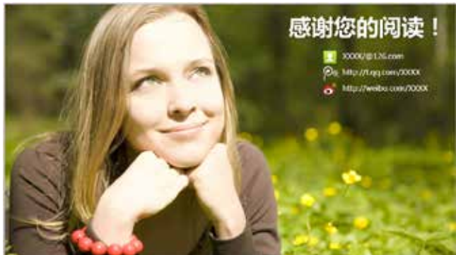
图 3-33 结束页 3