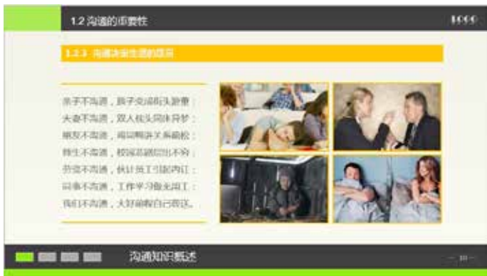
图 3-36 图像对齐排列

如图 3-36 所示的案例中，四幅图片上下左右相互对齐，左侧的文本框为了和右侧的图片达到上下对齐的效果，采用了在文本框上下添加线条的方式，这样整个页面就显得工整有序，美观大方。