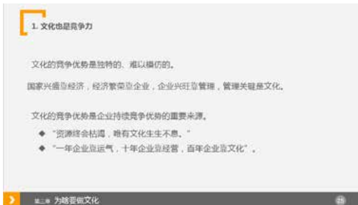
图 3-68 重点不突出，疲惫感强烈

文字的排版分为字少时的排版、字多时的排版以及文字的图表化处理。首先，字少时的排版讲究错落有致、突出重点。一般突出重点的方法有字体字号的设置、颜色的设置、加彩色背景图形等。有利于观众第一时间了解演讲者表达的内容。如图 3-68 和图 3-69 两幅图中的文字排版对比，从视觉上来说，后者明显比前者更清晰。