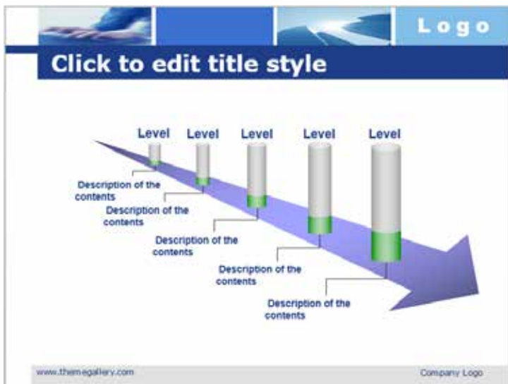
图 3-18 渐变构成效果

在制作 PPT 时，渐变构成是深受用户喜爱的一种构成方式，充分利用渐变效果，遵循构图法则，可以构造出华丽动感的画面，如图 3-18 所示。