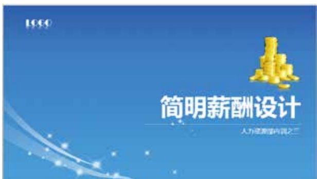
图 3-22 标题 + 背景型