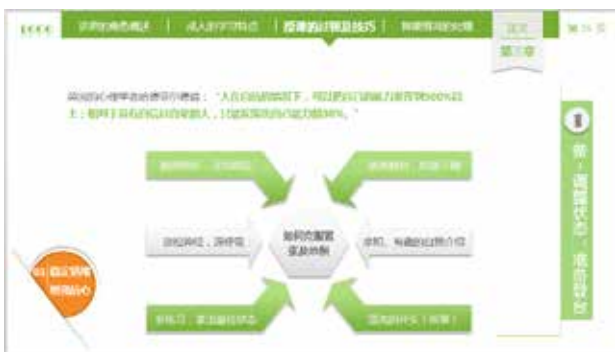
图 3-12 主题内容突出显示