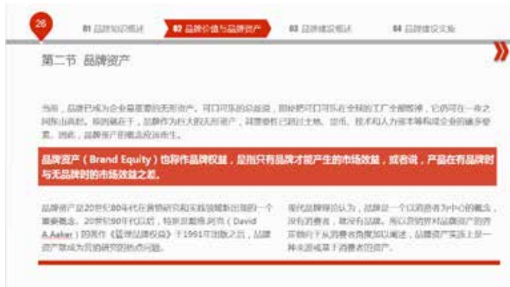
图 3-70 布局合理、规整匀称

其次，字多时的排版要求布局合理、规整匀称。从图 3-70 所示的案例可以看出，页面的排版规整有序，背景图形的运用使整个页面生动活跃，感官上也容易被观众接受。