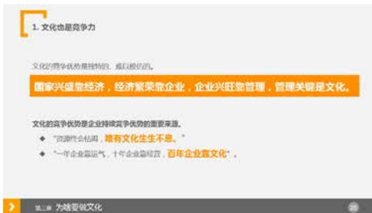
图 3-69 错落有致，重点突出