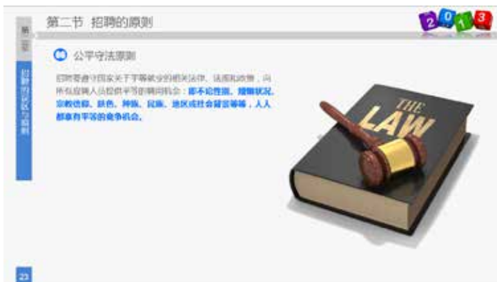
图 3-39 页面留白 1

在 PPT 设计中，留白是一个基本的要求，切忌“顶天立地”，也就是说，无论是在 PPT 中插入表格还是图片，都不应把页面排得满满当当，给人拥紧不堪的感觉，如图 3-39 和图 3-40 所示，留白处理就比较得当。