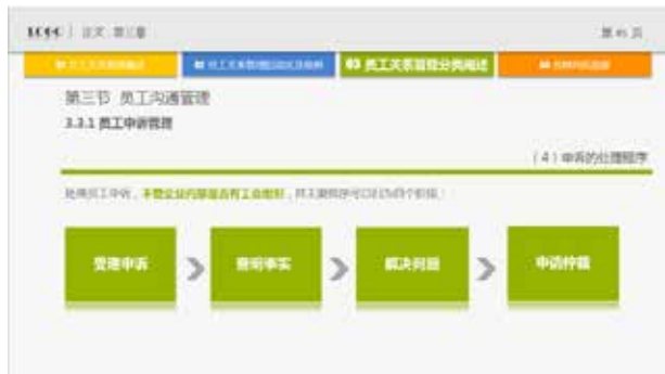
图 3-63 矩形框的应用

除以上几种图形之外，还有多种图形也可以提升 PPT 设计，如图 3-64 ~ 图 3-67 所示，请注意红色矩形框中的图形。