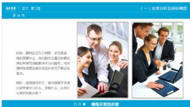
图 3-76 并列式排版

双图排版的要点是并列或对称。图片的面积会直接影响页面的传达，双图排版选用的一般都是中等大小的图片，再加上必要的文字叙述，整个画面会有图文并茂、相得益彰的效果，如图 3-76 和图 3-77 所示。