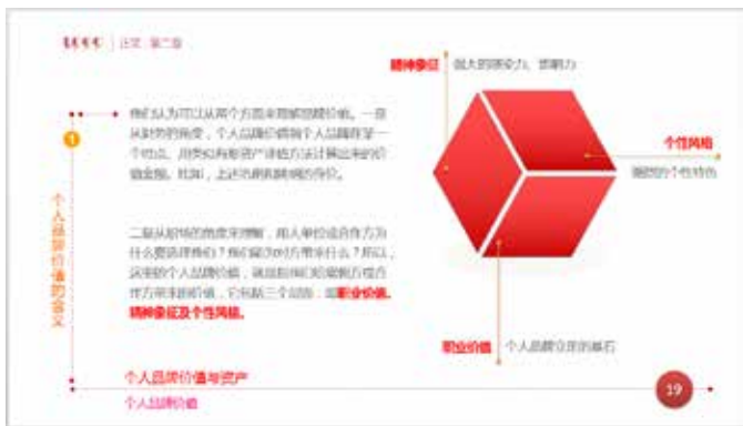
图 3-43 线应用于正文边界

如图3-43所示,在正文的边界应用了虚线线条,使得页面更加规整,再加上圆点的点缀,也给页面增加了美感。