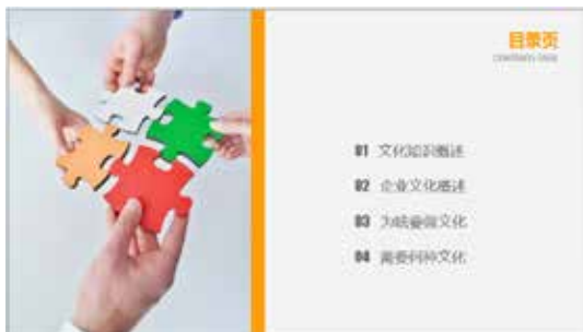
图 3-25 目录页 2