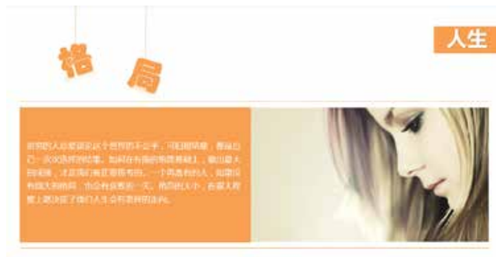
图 3-53 和图片连接形成区域