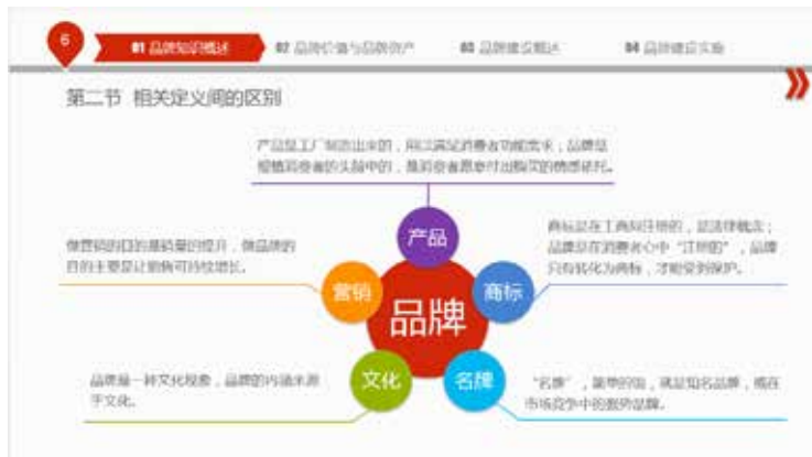
图 3-72 内容呈图形排版