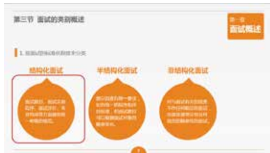
图 3-66 椭圆形标注的应用