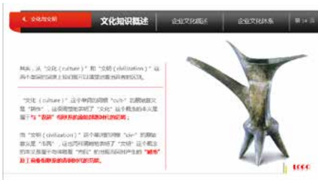
图 3-2 右置型布局