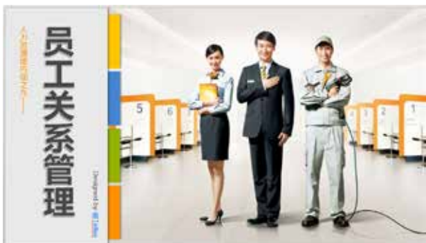
图 3-23 左右分隔型