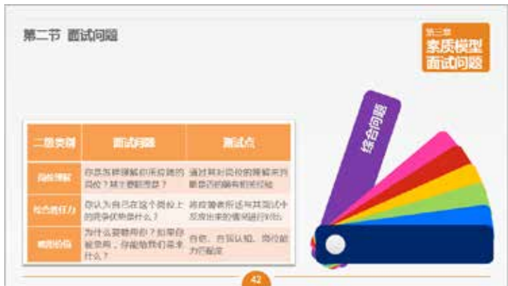
图 3-20 特异构成效果

在 PPT 中，若需要在若干个并列关系的对象中突出显示某一对象，可以采用特异结构，如图 3-20 所示。