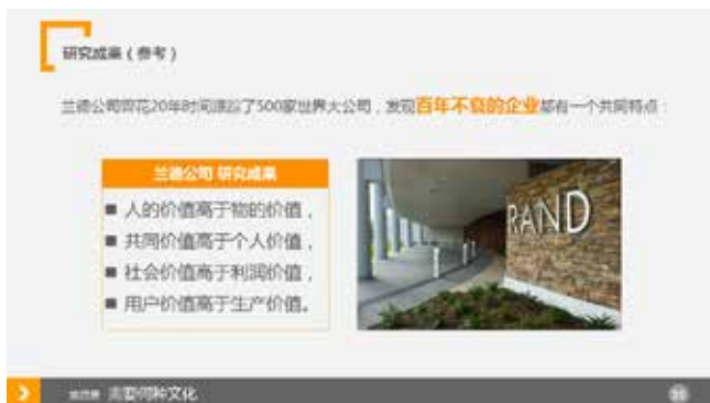
图 3-47 框的对齐效果

框的对齐效果比单纯的文本段落对齐更直观,另外,在引用寓言故事、名人名言、古诗词时都可以用框装饰,使这些文字更特殊化,如图 3-47 和图 3-48 所示。