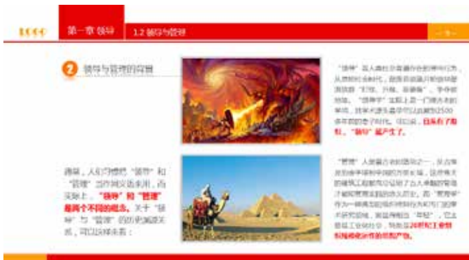
图 3-38 图片和右边文本框上下对齐