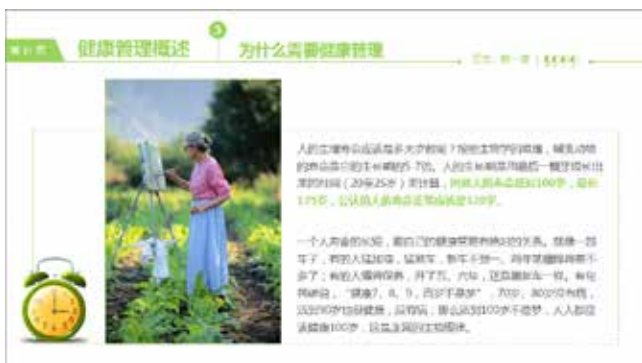
图 3-1 左置型布局

左置型布局是一种常见的版面编排类型，它往往将纵长型图片或图表放在版面的左侧，与右侧横向排列的文字形成强有力的对比，如图 3-1 所示。这种布局结构非常符合人们视线的移动规律，因而应用也比较广泛。与之对应的则是右置型布局，如图 3-2 所示。