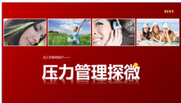
图 3-21 上下分隔型

图 3-21 ~ 图 3-23 是一些常见的首页设计版式，设计人员在实际的运用过程中应当根据演示的需要进行设计。