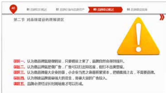
图 3-13 均衡的画面

以与一片淡灰获得均衡。黑色如与白色结合在一起时，黑色的重量就会减轻。从色彩的关系来说，一点鲜红色，可与一片粉红或一片暖黄色取得均衡。PPT 整个画面的均衡感是各种因素综合在一起而产生的，如图 3-13 所示。