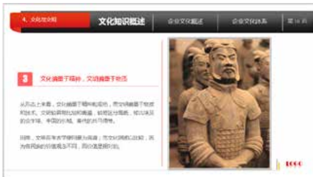
图 3-8 图片元素与主题相关