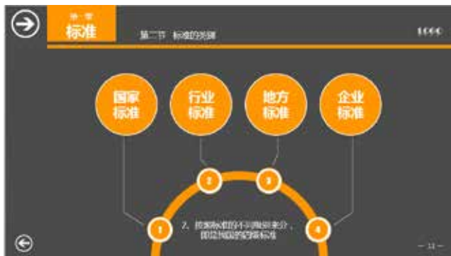
图 3-5 标题按半圆展开