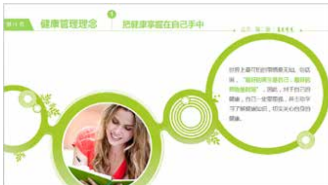
图 3-50 圆圈的应用 2