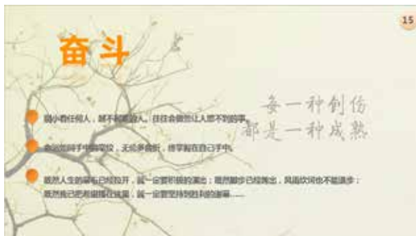
图 3-61 页面编码和序号背景