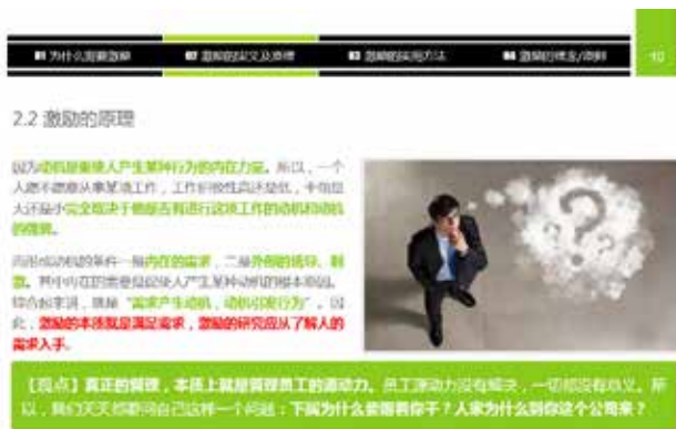
图 3-34 PPT 距离的排版

在 PPT 设计中，通过合理调整文本之间的距离，也能使内容条理分明，促进演讲者与观众之间的沟通，在此所说的“间距”包括边距、行距、段距。笔者建议除非特别需要，千万不要将大段文字紧密排列，可以通过适当更改字体颜色、行间距等，让读者减少对文本过多的恐惧，如图 3-34 所示。不过，笔者不建议过分调整文字间距。