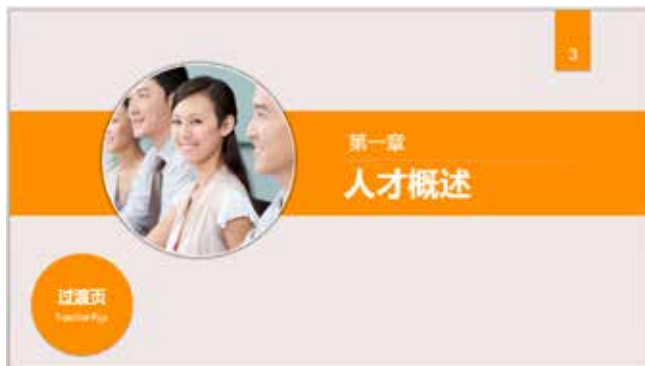
图 3-30 图文结合式过渡页