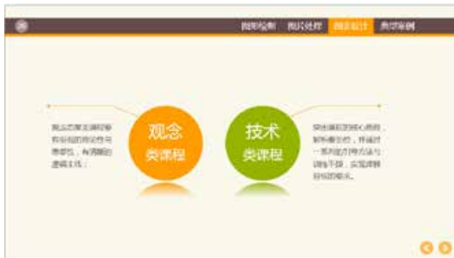
图 3-6 中轴对称型布局

将标题、图片、说明文与标题图形放在轴心线或图形的两边，这样能显示出良好的平衡感，如图 3-6 所示。