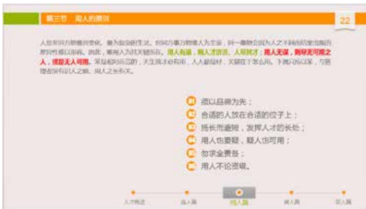
图 3-40 页面留白 2

当然，大片空白不能乱用，一旦空白，必须有呼应，有过渡，以免为留白而留白，造成版面空乏。