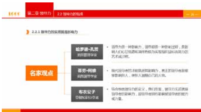
图 3-42 正文中应用线条

“线”在正文中的应用,起到对不同内容的分割作用。以及应用在正文的边界,用“线”勾勒出画面中模块内容的边界,形成规矩、整齐的效果。如图3-42所示,通过线条将不同的观点进行有效的整合和划分。