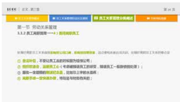
图 3-81 背景式标题