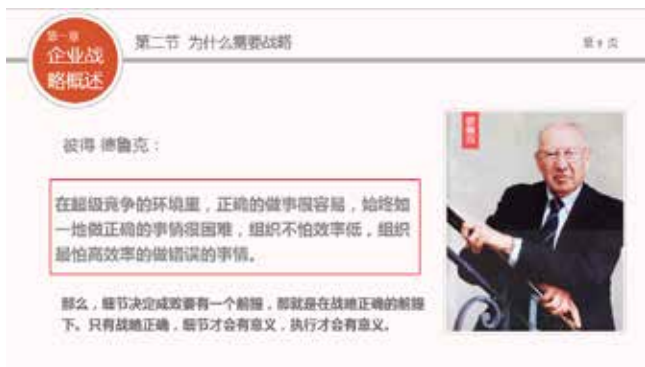
图 3-48 引用名人名言