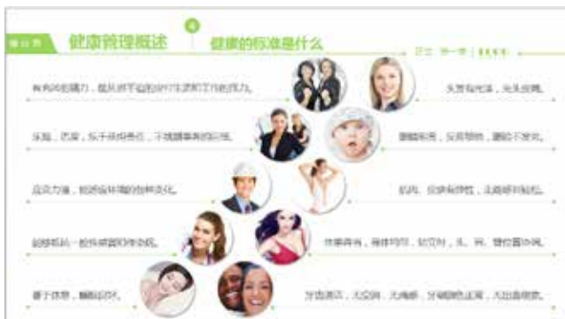
图 3-3 斜置型布局

在布局时，全部图形或图片右边（或左边）作适当的倾斜，使视线上下流动，画面产生动感，令呆板的画面活跃起来，如图 3-3 所示。