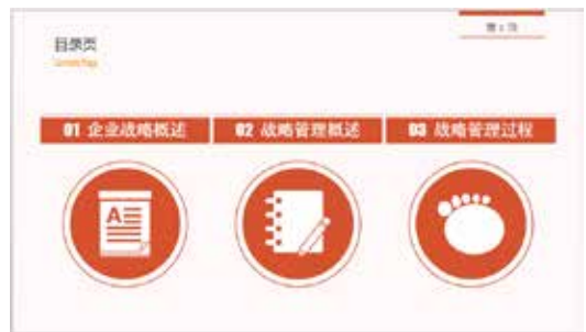
图 3-27 目录页 4