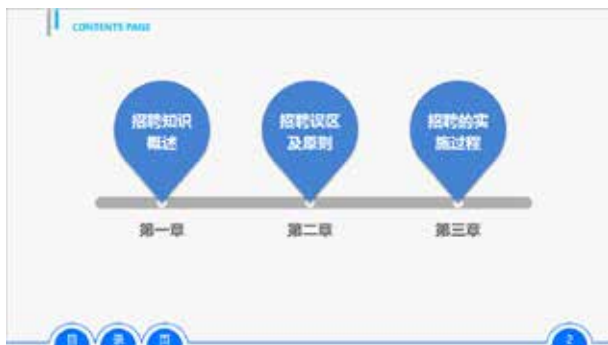
图 3-60 应用于文本框

此图形可作为页面编码或序号的背景图形，也可作为文本框的背景图形，或者放置在页面的边角作为点缀作用，如图 3-60 和图 3-61 所示。