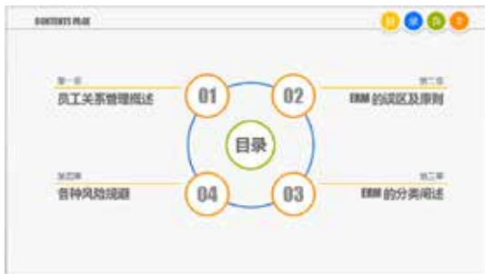
图 3-24 目录页 1

当然，每个人的设计理念都是不一样的，以上也只是列出了一些常见的目录页制作方法。图 3-24 ~ 图 3-27 是几种常见的目录版式结构。