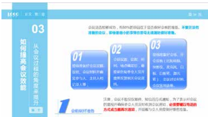
图 3-52 色块形成模块

如图 3-52 所示的页面，文字内容较多，如果单独把文本进行罗列，就会显得枯燥无味，而把不同的模块利用几个色块分别展示，就使得页面的条理性更加清晰，结构也一目了然。