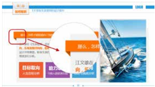
图 3-67 三角形形成的立体效果