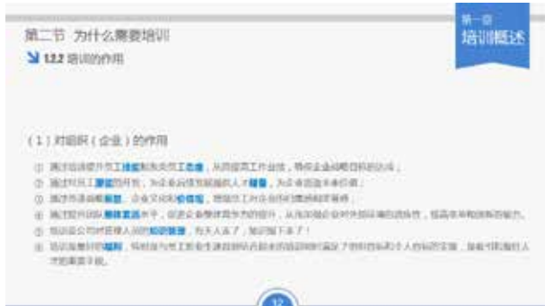
图 3-80 点缀式标题