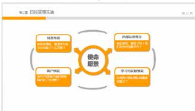
图 3-4 以正圆作为版面中心

以正圆或半圆构成版面的中心，在此基础上按照标准型顺序安排标题、说明文本以及其他对象，可以一下吸引观众目光，突出重点内容，如图 3-4 和图 3-5 所示。