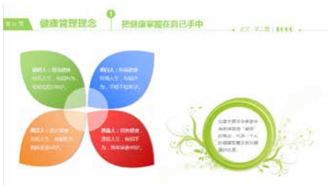
图 3-41 标题中应用线条

线条应用在标题设计上,使标题和正文内容分开,使PPT页面各模块更清晰分明。如图3-41所示的页面,就利用线条将标题部分进行了划分,使得层次更加分明,同时也使得标题更加美观耐看。