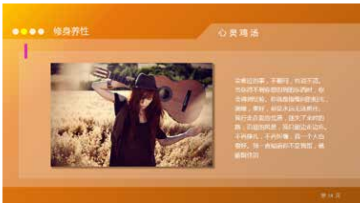
图 3-51 面的应用

面设计出整体内容页的版面，同一页面中设置不同层次的面，会使画面的逻辑感更强烈，如图 3-51 所示。在橘色的背景上面，设置两层有透明度的白色的“面”，从而形成了有层次感的视觉效果。