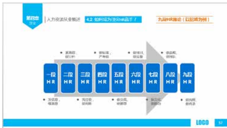
图 3-17 重复构成流程图表