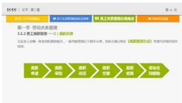
图 3-59 应用于文本框