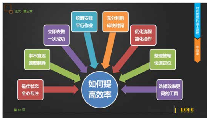
图 3-19 发射构成效果

在一张幻灯片中，若需要突出显示某内容，可以采用该构成方式，将需要突出显示的内容作为构图的中心点，其他辅助说明内容作为辐射即可；若需要突出显示某些重点内容，可以采用向外或者向内辐射的方式，并排显示这些内容，如图 3-19 所示。