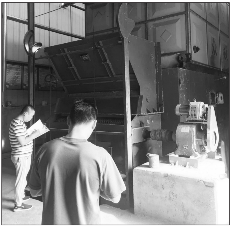
江西省新余市近日开展燃煤锅炉验收及“回头看”专项整治工作,对去年淘汰改造的153台10蒸吨以下燃煤锅炉进行了复核,并启动建成区35蒸吨以下燃煤锅炉整治工作,确保全部淘汰改造到位。

放工作进行部署。二是开展丰富多彩的活动。省环保厅联合省委宣传部、省文明办、省直机关工委、团省委,开展“践行生态文明做绿色低碳生活的传播者”实践活动,并制作微视频进行参展比赛;开展第二届全省百所高校青年志愿者环保宣传实践活动;继续开展第七批省级“绿色学校”创建活动;开展中国少年儿童主题教育示范课江西8所学校专题讲座活动。三是制作生态文化宣传产品。拍摄微视频《鄱阳湖畔候鸟守护者》——讲述普通人的环保故事;《烈日下的拼搏——讲述环保人的故事》;拍摄环保公益广告片在江西卫视播出;制作《公民环保设施行为准则》公益广告在江西广播电视台播出。