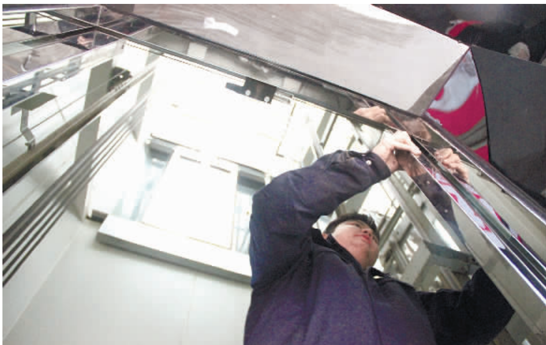
3月6日,长沙市五一广场,一名师傅在维修电梯。

“电梯年检是目前保证电梯安全运行最重要的一项工作,却有部分物业忽视。”长沙市质量技术监督局法制处处长张文革介绍,这样的电梯一般被称为带病运行电梯,目前长沙4.1万台电梯中大约有2000多台电梯处于带病运行状态。“很多电梯因为平时的保养和维修跟不上,导致无法通过年检。”