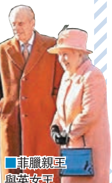
菲臘親王與英女王