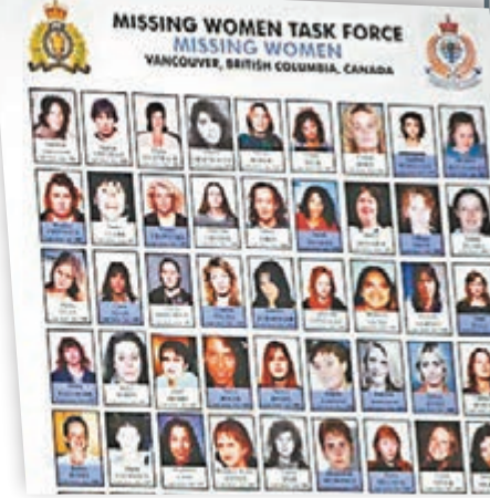
當局懷疑69名女性的失蹤與皮克頓有關。

消息曝光後引起輿論譁然，有受害人家屬表示憤慨，出版社和亞馬遜在5萬多名網民聯署下將回憶錄下架，並向家屬致歉。當局正調查犯人如何把手稿偷運出監獄，並研究修例阻止在囚犯人借出版回憶錄牟利。