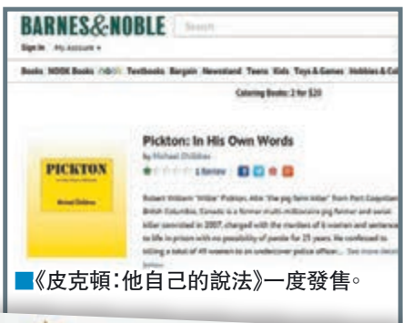
《皮克頓：他自己的說法》一度發售。

加拿大卑詩省一名連環殺人犯在獄中撰寫回憶錄，並透過自資出版社出書，然後在網上書店亞馬遜發售，試圖為自己洗脫罪名。消息曝光後引起輿論譁然，有受害人家屬表示憤慨，出版社和亞馬遜在5萬多名網民聯署下將回憶錄下架，並向家屬致歉。當局正調查犯人如何把手稿偷運出監獄，並研究修例阻止在囚犯人借出版回憶錄牟利。