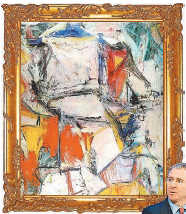
德庫寧的《交換》 格里芬分別以23.3億及15.5億港元購入《交換》及《17A號》。

國際藝術品市場近年蓬勃發展，接連誕生天價成交，有業內人士透露，美國知名對沖基金經理格里芬去年秋季斥資5億美元(約38.8億港元)，從夢工場創辦人之一格芬手上，購入兩幅抽象表現主義名畫，相信是歷來成交金額最高的藝術品交易。