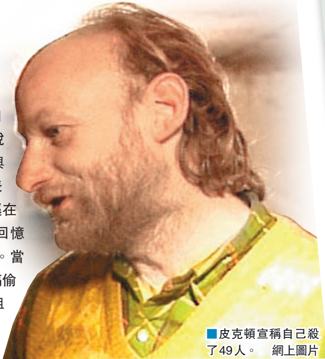
皮克頓宣稱自己殺了49人。

消息曝光後引起輿論譁然，有受害人家屬表示憤慨，出版社和亞馬遜在5萬多名網民聯署下將回憶錄下架，並向家屬致歉。當局正調查犯人如何把手稿偷運出監獄，並研究修例阻止在囚犯人借出版回憶錄牟利。