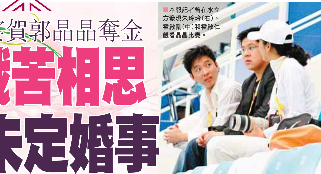
■本報記者曾在水立方發現朱玲玲(右)、霍啟剛(中)和霍啟仁觀看晶晶比賽。

而現任男友霍啟剛，對於很少與外界接觸的郭晶晶，霍啟剛給她帶來前所未有的新鮮感。霍啟剛的處事開明、善解人意讓兩人最終明確了情侶關係。郭晶晶更不避嫌疑，一臉幸福對外界宣布「人人都要談戀愛，我也一樣。」