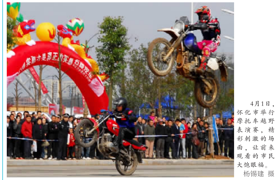
4月1日,怀化市举行摩托车越野表演赛,精彩刺激的场面,让前来观看的市民大饱眼福。

武陵源区军地坪街道办事处是陈红日的学习实践科学发展观活动联系点。考虑到实现“建设国际旅游休闲度假区,率先建成世界旅游精品”总目标是全区干部群众共同努力的理想,其中需要党员、干部有坚韧不拔的精神,懂得更多的管理知识,陈红日别出心裁地提出为全区党员、干部每人赠送《把信送给加西亚》和《二十一世纪管理模式》两本书。其中,他自己拿出1600元钱为联系点党员、干部买书。