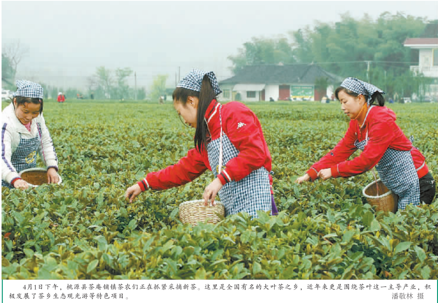
4月1日下午,桃源县茶庵铺镇茶农们正在抓紧采摘新茶。这里是全国有名的大叶茶之乡,近年来更是围绕茶叶这一主导产业,积极发展了茶乡生态观光旅游等特色项目。

本报4月2日讯(罗永良 罗娟 段云行)4月1日,香港烛光教育基金会捐资30万元人民币援建桥亭联校奠基仪式在双峰县石牛乡桥亭中学举行。该基金会是香港著名教育家陈昌立先生于2000年创办的。2007年,香港烛光教育基金会曾捐资35万元援建双峰县梓门桥镇星火联校。