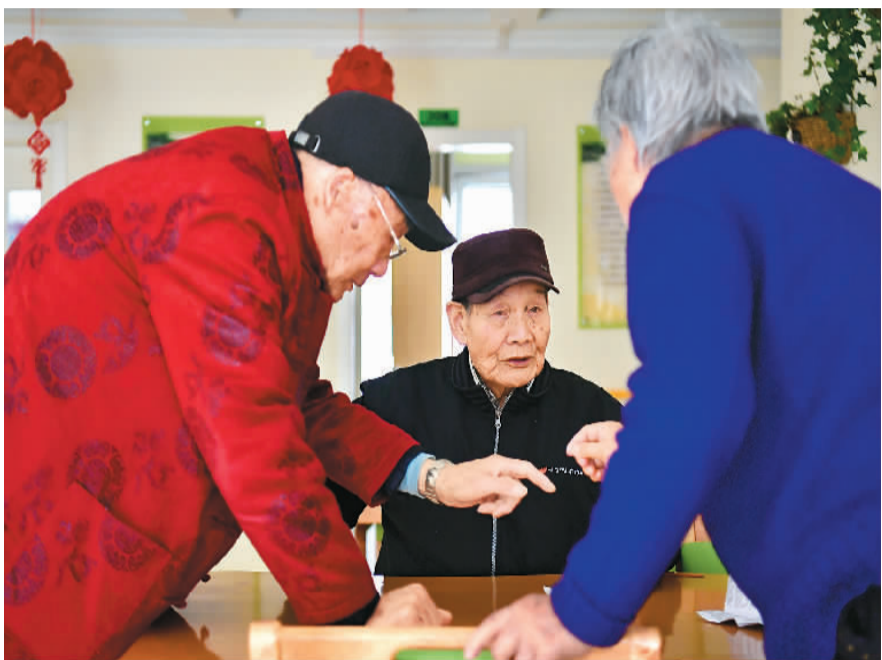
老人们在青海省西宁市新宁路社区养老院聊天。

近日，国务院常务会议提出，要依托“互联网+”提供“点菜式”就近便捷养老服务，支持连锁化、综合化、品牌化运营。互联网，正越来越深入老年人的生活。