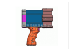
LUYOR3105便携式探伤紫外灯