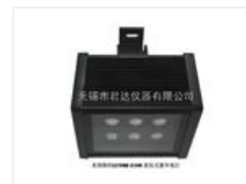
LUYOR3106吊挂式探伤紫外灯