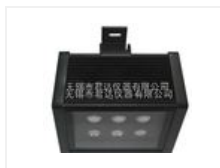
LUYOR3100系列吊挂式探伤紫