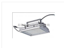
大面积紫外探伤灯LUYOR-