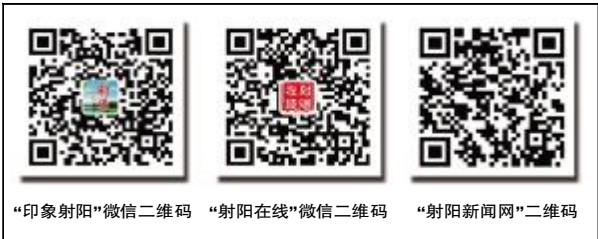
“印象射阳”微信二维码 “射阳在线”微信二维码 “射阳新闻网”二维码