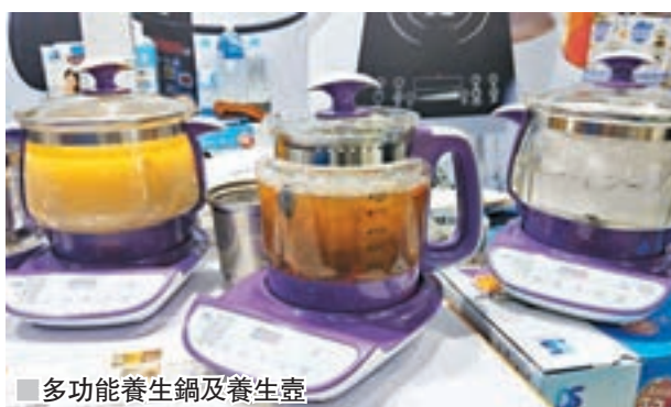
■多功能養生鍋及養生壺