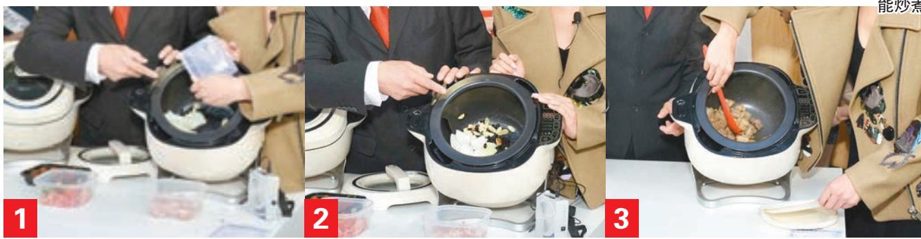
■示範使用IH全能炒煮料理機來烹調豉椒排骨，方便快捷。