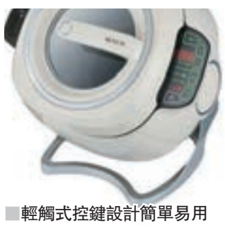
■輕觸式控鍵設計簡單易用