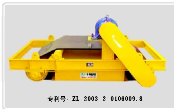
专利号：ZL 2003 2 0106009.8