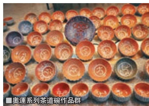
■奧運系列茶道碗作品群