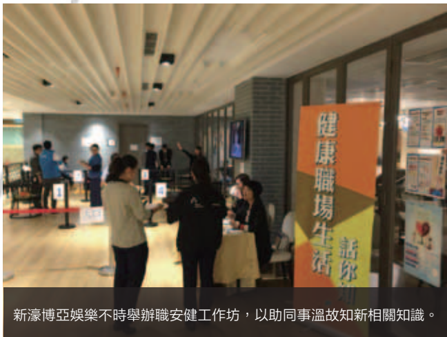
新濠博亞娛樂不時舉辦職安健工作坊，以助同事溫故知新相關知識。

為表揚僱員在提高職安健績效所做的努力，我們推行職安健獎勵計劃，連續八年每季向對於工作場所安全作出最大貢獻的僱員發放現金獎。我們亦透過員工內部電視網絡，於澳門所有僱員共用地方播放每月職安健最新資訊，推廣安全至上的理念。