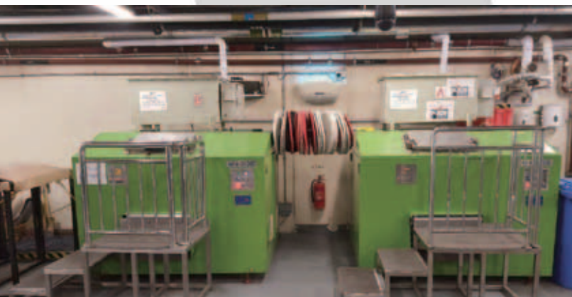
新濠天地安裝了可作生物化解的廚餘處理器，將廚餘食物轉化成有機肥料。