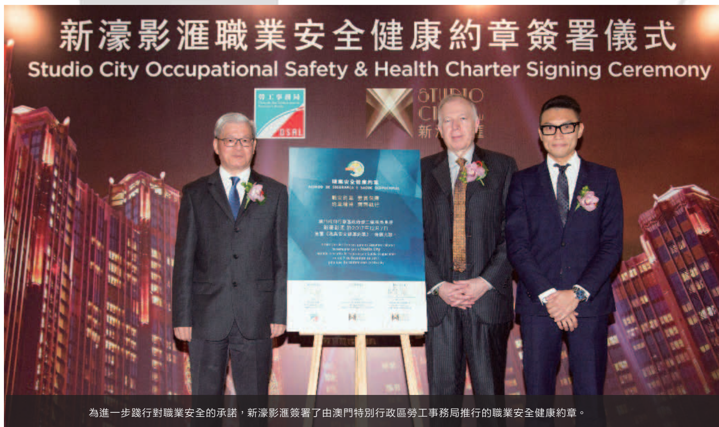
為進一步踐行對職業安全的承諾，新濠影滙簽署了由澳門特別行政區勞工事務局推行的職業安全健康約章。