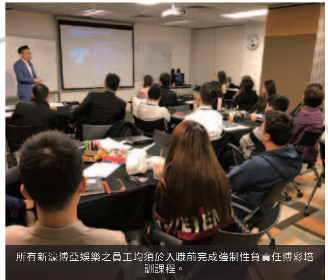
所有新濠博亞娛樂之員工均須於入職前完成強制性負責任博彩培訓課程。

集團針對每宗工作場所事故個案進行內部調查。人力資源部門收到事故報告後，隨即與負責跟進調查的職安健委員會共同審視「意外事故表格」。為防止同類事故再次發生，相關人士會採取相應糾正措施。我們的危險及險失事故報告計劃，亦有效在潛在工傷事故發生之前匯報並糾正不安全情況，防止事故發生。