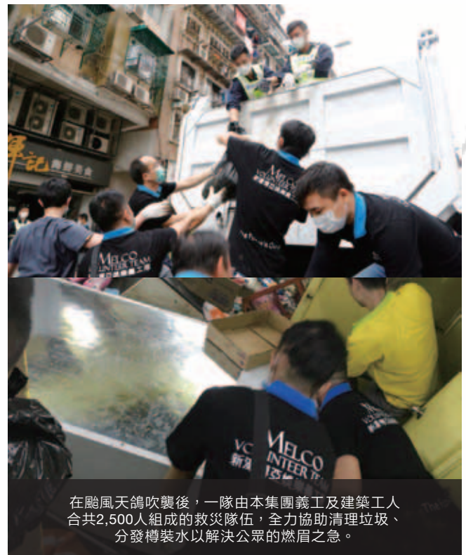
在颱風天鴿吹襲後，一隊由本集團義工及建築工人合共2,500人組成的救災隊伍，全力協助清理垃圾、分發樽裝水以解決公眾的燃眉之急。

颱風天鴿吹襲澳門造成廣泛破壞，令人悲痛難忘。我們冀與全澳一同群策群力，迅速為社區提供支援，協助重建。在颱風天鴿襲澳後，新濠博亞娛樂立即撥出3,000萬澳門元現金成立救災基金，並調派志願隊伍支援僱員、社區及災後重建工作。我們當時立即叫停摩珀斯新酒店大樓的建設工程，並將全數2,000名建築工人調派至政府領導的救援團隊提供協助，力求恢復災情最嚴重地區的市容。我們亦迅即動員志願者，幫助受影響的居民及商戶清理街道上的瓦礫、分發瓶裝水和生活必需品，以及跟進普羅大眾的即時需要。我們有幸能為社區略盡綿力，協助澳門迅速恢復秩序。