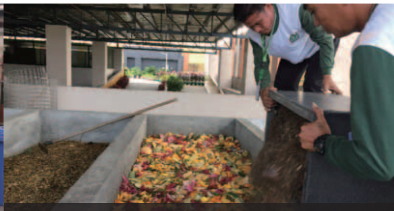
新濠天地(馬尼拉)積極推行廚餘回收計劃，將有機廢物轉化為營養豐富的肥料，以妥善管理廚餘。

為善用食肆產生的廚餘，新濠天地(馬尼拉)採用蚯蚓糞生物堆肥技術，將有機廢物轉化為營養豐富的肥料。堆肥過程中，非洲夜蚯蚓會放置到蔬果和園藝廢料的混合物內，生產出營養豐富的肥料，供物業內的園藝之用。計劃推行後，新濠天地(馬尼拉)每季節省約15%園藝消耗品開支，並減少使用化學肥料及殺蟲劑，實現可持續園藝發展，促進營運的環境安全及健康。