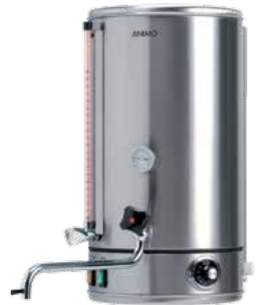
+ WKI - 系列