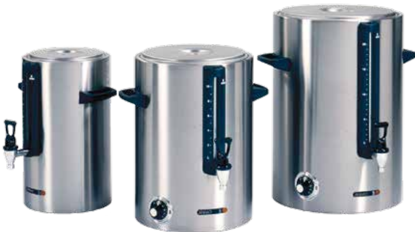
+ WKT-D - 系列