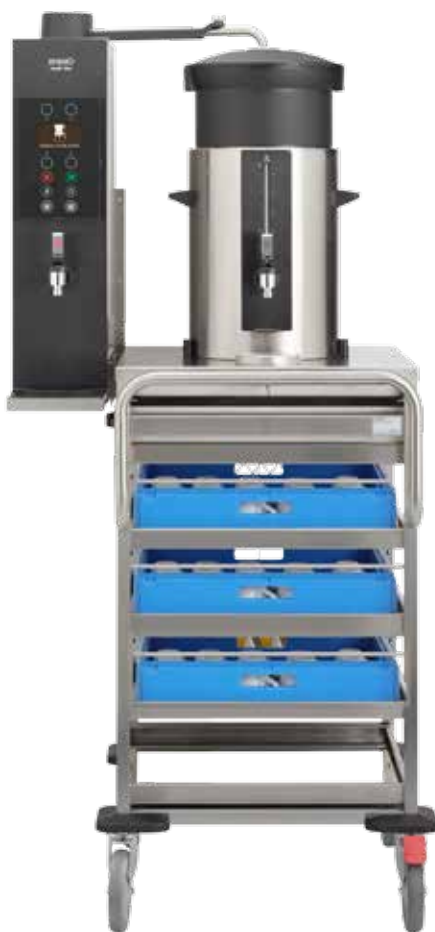
+ SK 10 VL 型