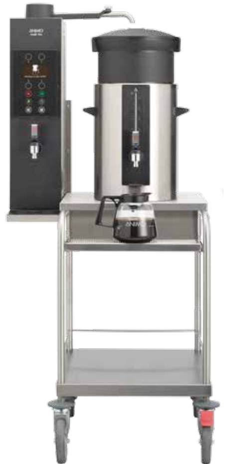
+ S 型