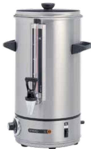
+ WKT - 系列