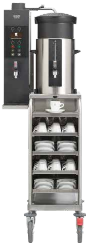
+ JR 型 (ST 型适合大保温桶)