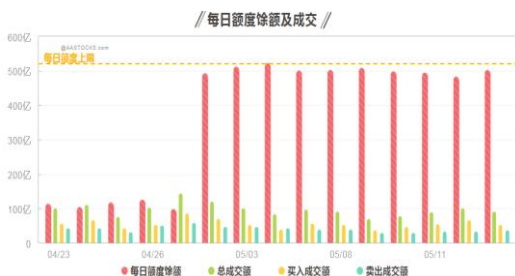
每日沪港通额度变化图

2018年4月份，规模以上工业增加值同比实际增长7.0%（以下增加值增速均为扣除价格因素的实际增长率），比3月份加快1.0个百分点。从环比看，4月份，规模以上工业增加值比上月增长0.61%。1-4月份，规模以上工业增加值同比增长6.9%。分三大门类看，4月份，采矿业增加值同比下降0.2%，制造业增长7.4%，电力、热力、燃气及水生产和供应业增长8.8%。