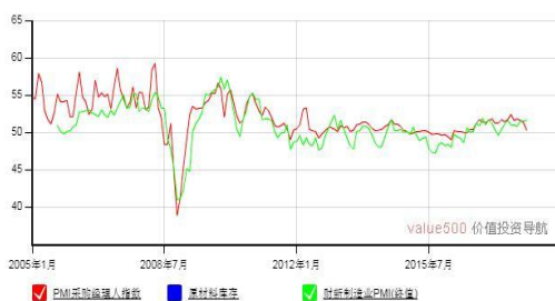
中国 PMI 走势图