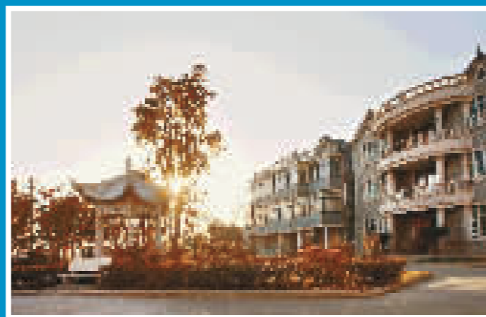
北区贵驷街道人居环境不断提升。