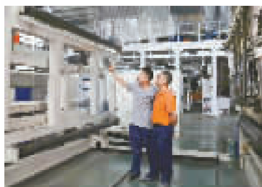
北区工业制造企业创新能力不断增强。