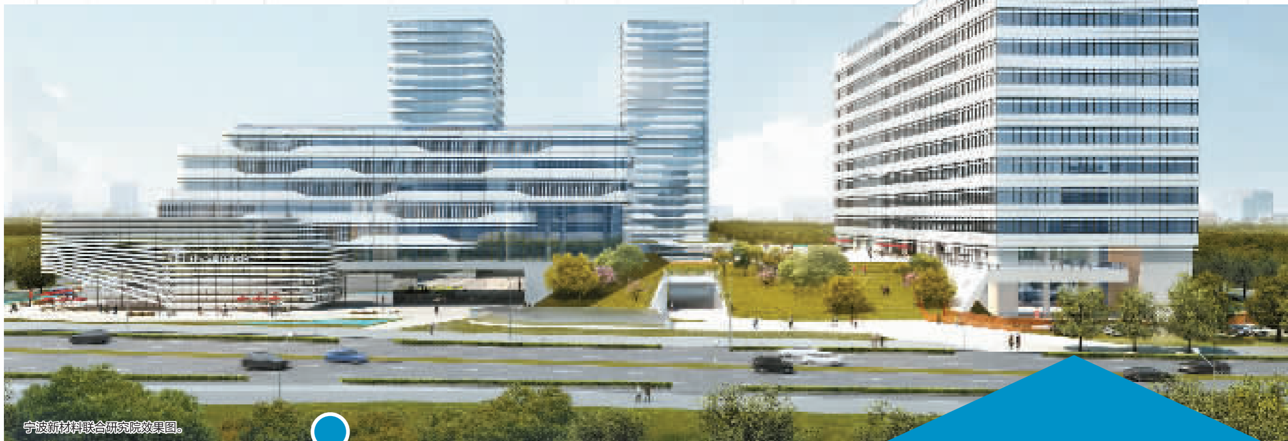
宁波新材料联合研究院效果图。