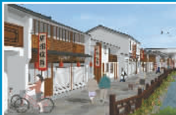
贵驷街道小城镇环境综合整治持续推进。