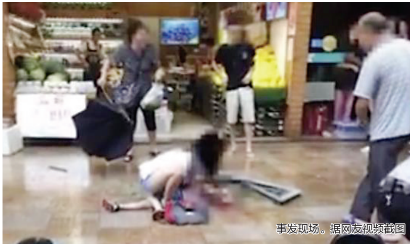
事发现场。据网友视频截图