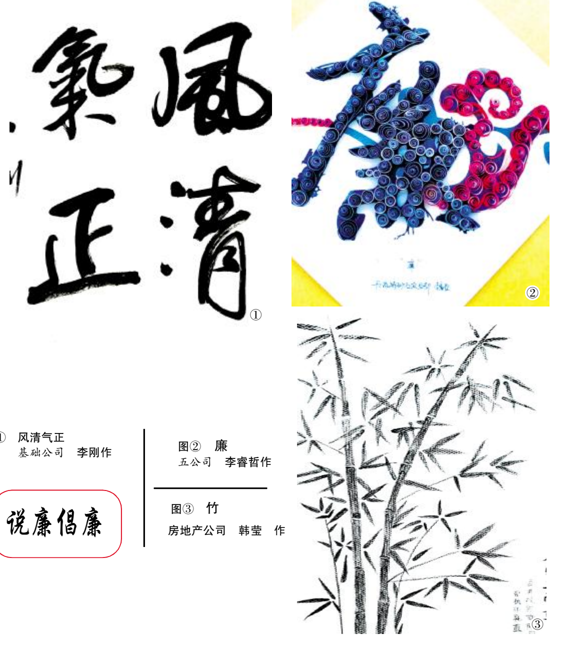
图① 风清气正 基础公司 李刚作

◆作为央企党员领导干部,要坚决拥护、坚定支持国家监察体制改革,认真学习《监察法》,自觉做到廉洁自律。宣教月期间,水务运营公司在认真落实规定动作的基础上,开展了录制家庭廉政提醒视频、寄送倡廉信、家属谈感言等活动,党员干部党性修养和遵规守纪意识进一步增强。 ——水务运营公司党委书记、董事长杨贞武