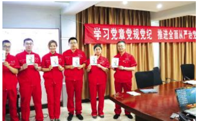
电力公司开展落实“十五个严禁”宣传活动