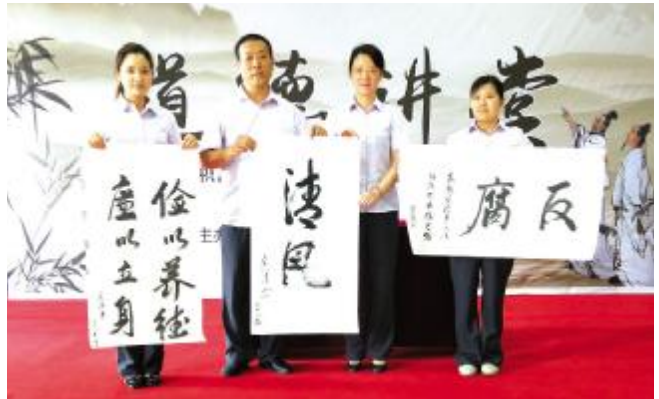
公路公司组织支部书记现场书廉字作品