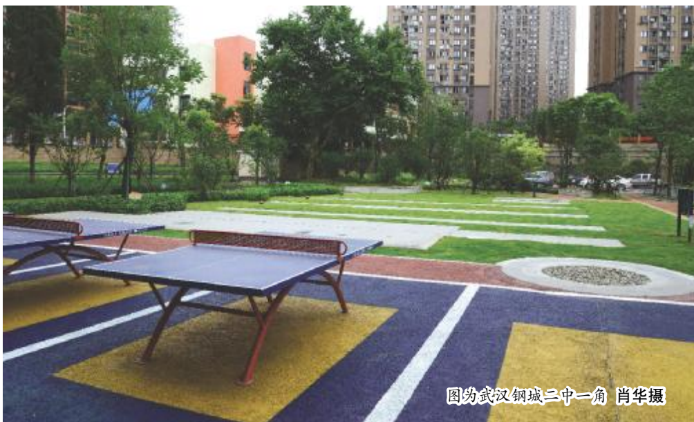
图为武汉钢城二中一角

两年前的一场暴雨,导致整个学校平均积水超1米,一楼教室全被淹。当时的场景,张师傅历历在目。如今,钢城二中经过葛洲坝的海绵改造后,不再逢雨必涝,被国家住建部中国建设报评为“校园样板”。