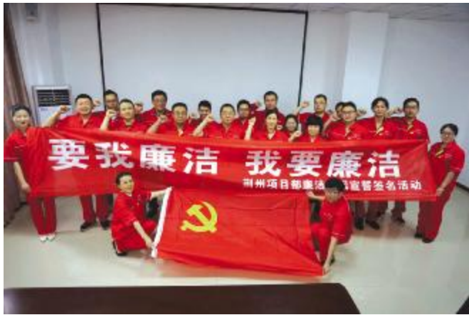
三公司荆州项目部开展廉洁宣誓签名活动