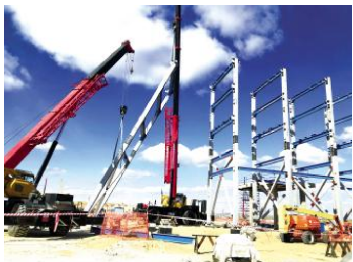
右图:阿根廷基塞项目施工现场