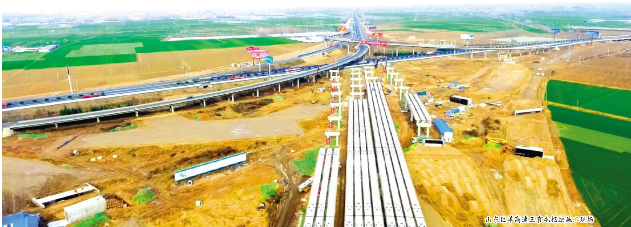
山东巨单高速王官屯枢纽施工现场