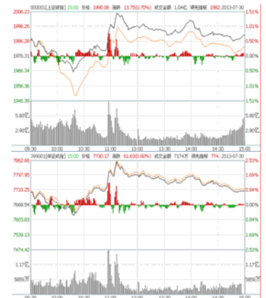
当天沪深大盘表现

盘中中小贷公司、淘汰落后产能涉及的水泥、有色等板块表现抢眼。但目前周期品的供需矛盾来自于供给与需求两方面，淘汰落后产能是长期对供给的优化，短期难以见效，市场的炒作氛围难以持续，技术上，上档均线系统压力沉重，同时日线MACD红柱日渐萎缩，创业板指也呈下跌破位迹象，建议反弹中继续减磅操作。