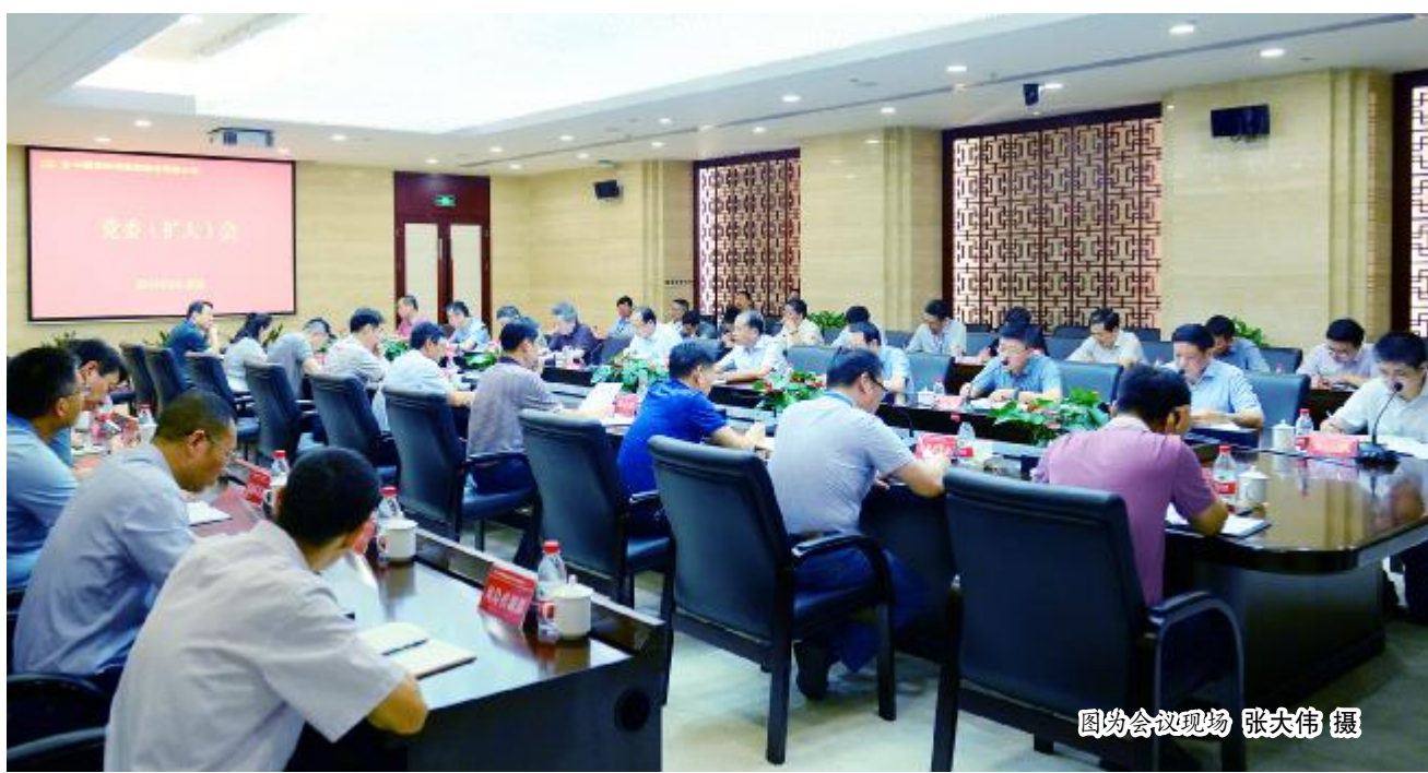
图为会议现场

外经济形势的新变化、新特点,积极应对。要着眼大局谋划发展,正视现实迎接挑战,实事求是解决问题,不折腾,不盲动,把握节奏,防范风险。要牢牢掌握政治方向,始终坚持战略引领,持续加大市场开拓,全面加强管理提升,严格落实党建责任,大力营造风清气正、干事创业良好环境,推动集团股份公司各项工作迈上新台阶。