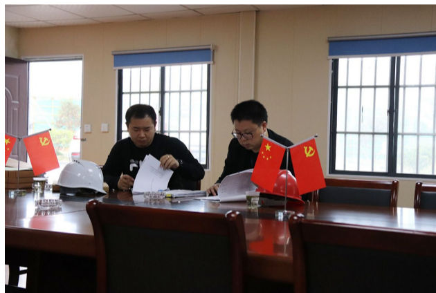
建筑工地走访