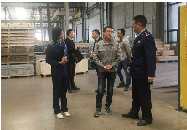
检查优迈科技生产车间