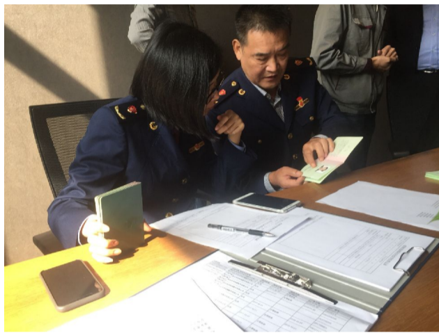
区市场监督管理局人员在检查证件

在电梯方面,今年我区已经为300台电梯装上了“智慧大脑”——智能监管装置。智慧监管装置采用物联网、人工智能等技术,能实现电梯状态实时监测,重点对轿厢运行方向、当前层站、轿门开闭等运行状态参数及电梯运行过程中故障信息等实时监测,及时发出预警,实现闭环处置。同时对用手或物挡门以及电梯内吸烟、跳动、打斗等不文明乘梯行为能自动识别,并通过语音进行劝阻,降低电梯故障率。通过该装置,原先事后监管向事前、事中、事后全过程监管转变,有效提高风险防控能力。