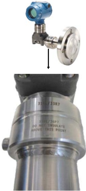
图 2. 宽温扩展系统隔热注意事项

宽温变送器扩展系统使用过程中产生的热量，确保系统中的两种介质正常发挥功用，因此不需要始终隔热。但是，隔热永远是确保系统可以发挥最优效能的最佳方法。温度范围扩展部件不可在密封主体标记线以上的位置进行隔热，具体请参阅下图。