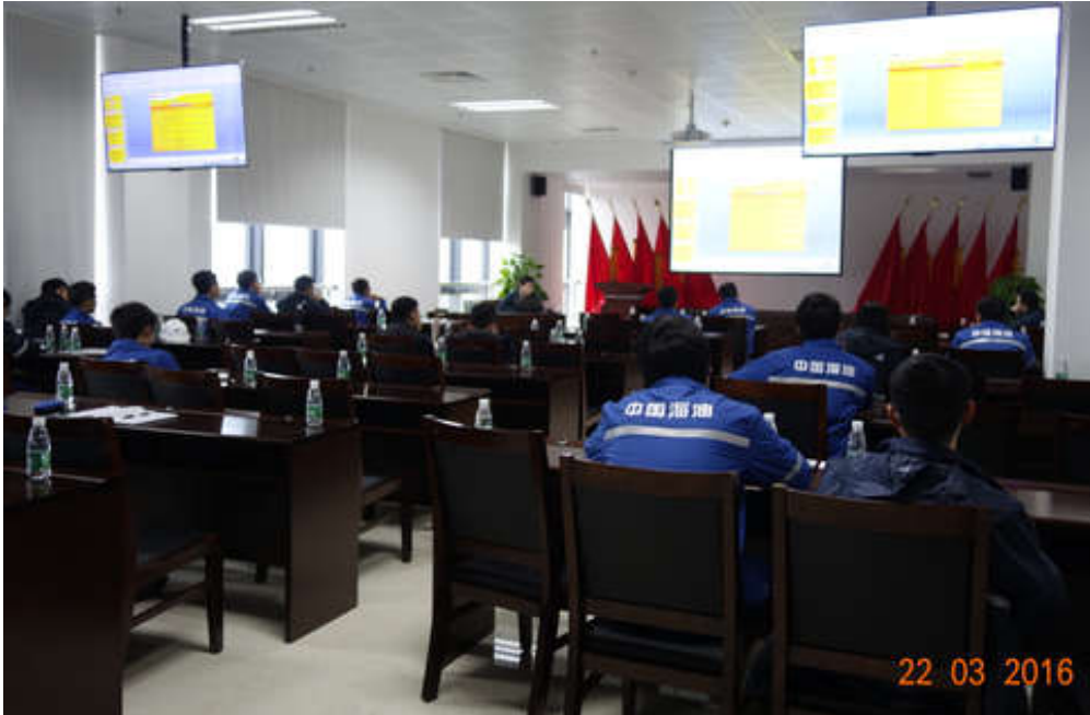
【中海油粤东液化天然气有限责任公司】