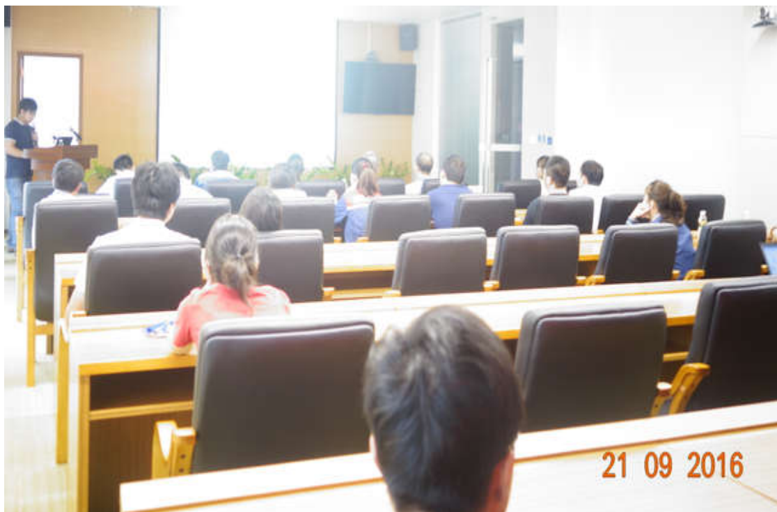
【中海油海南天然气有限责任公司】