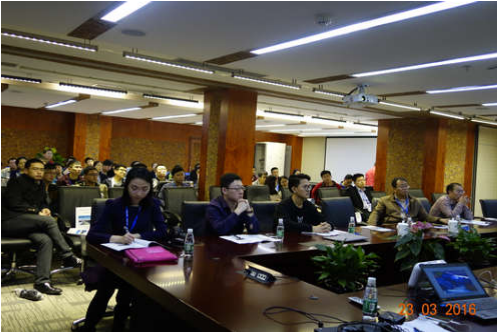
【中海油广东珠海金湾液化天然气有限公司】