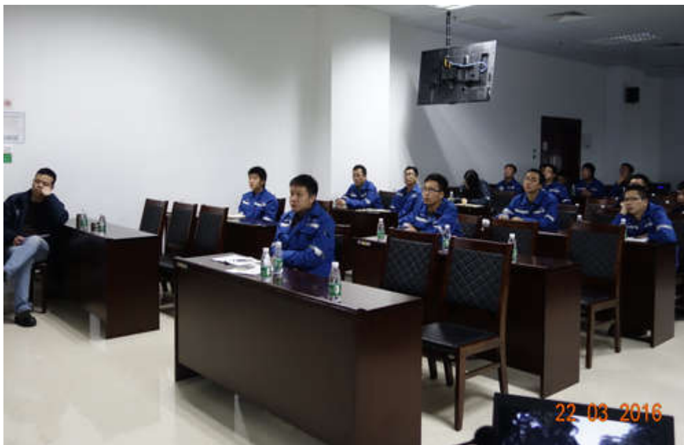
【中海油粤东液化天然气有限责任公司】