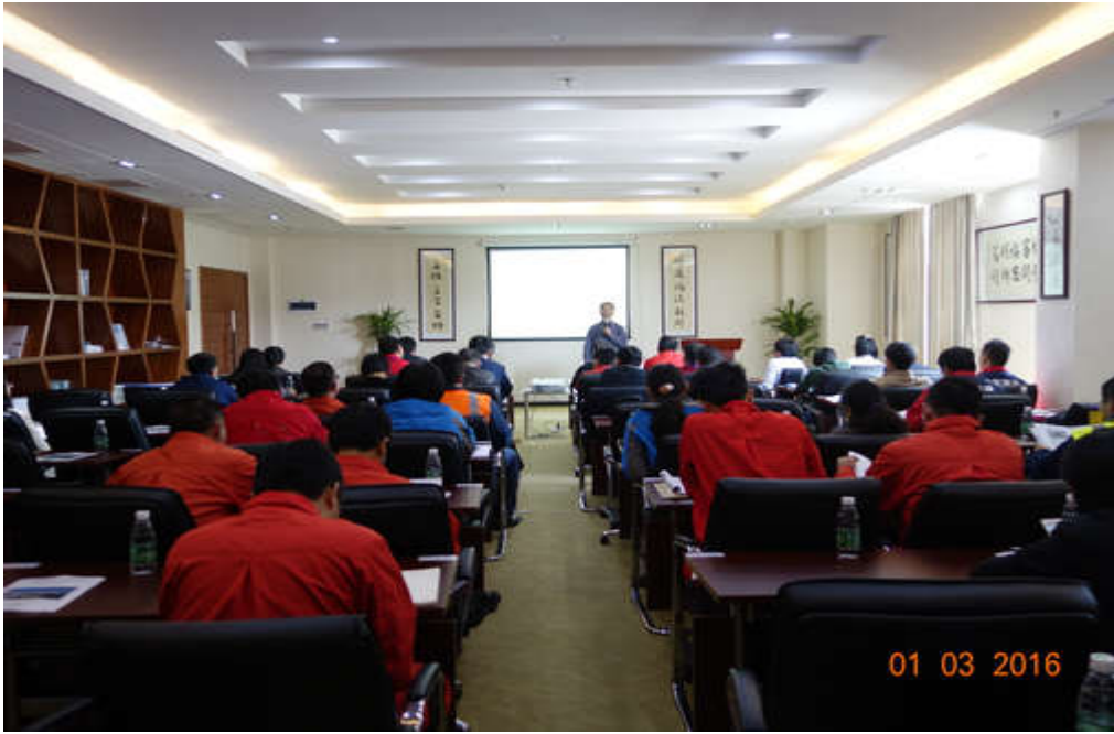
【中海油广东珠海金湾液化天然气有限公司】