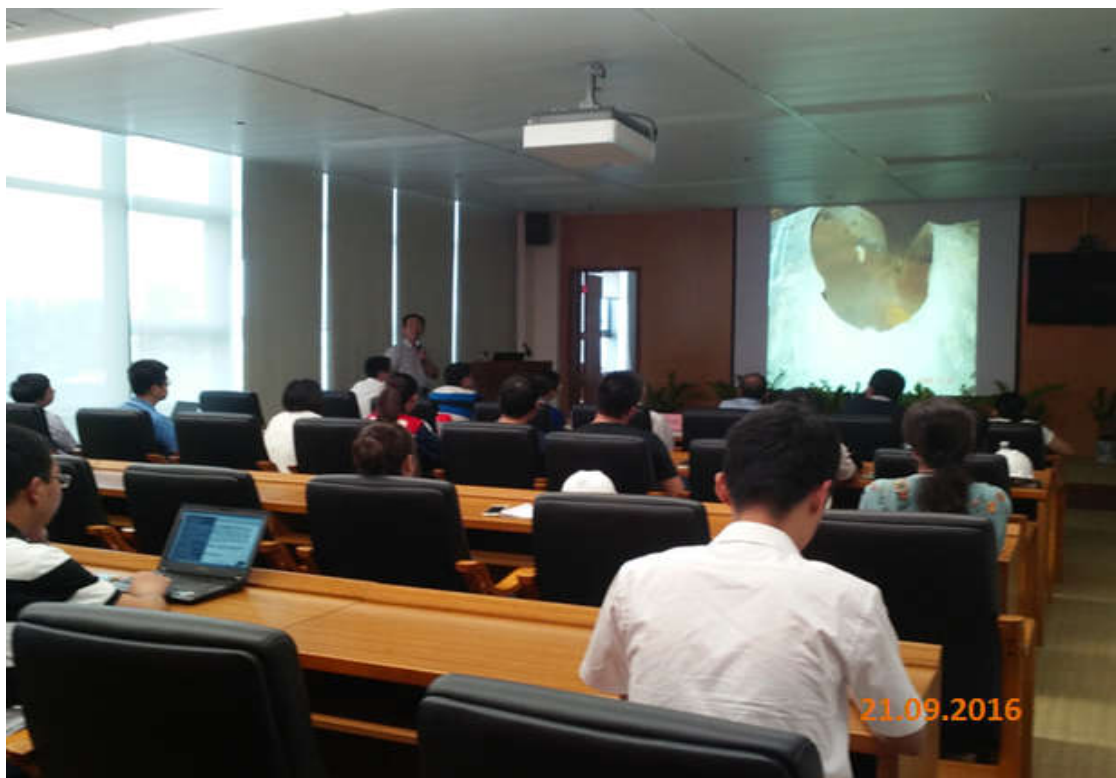
【中海油海南天然气有限责任公司】