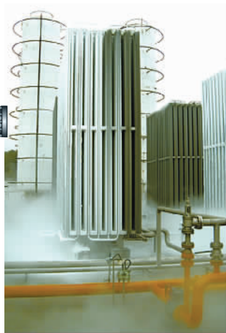
今年6月,长沙新奥星沙1200万方LNG储配站竣工,目前进入试运行阶段,运行正常后可保障长沙市居民用户8-10天的正常用气。