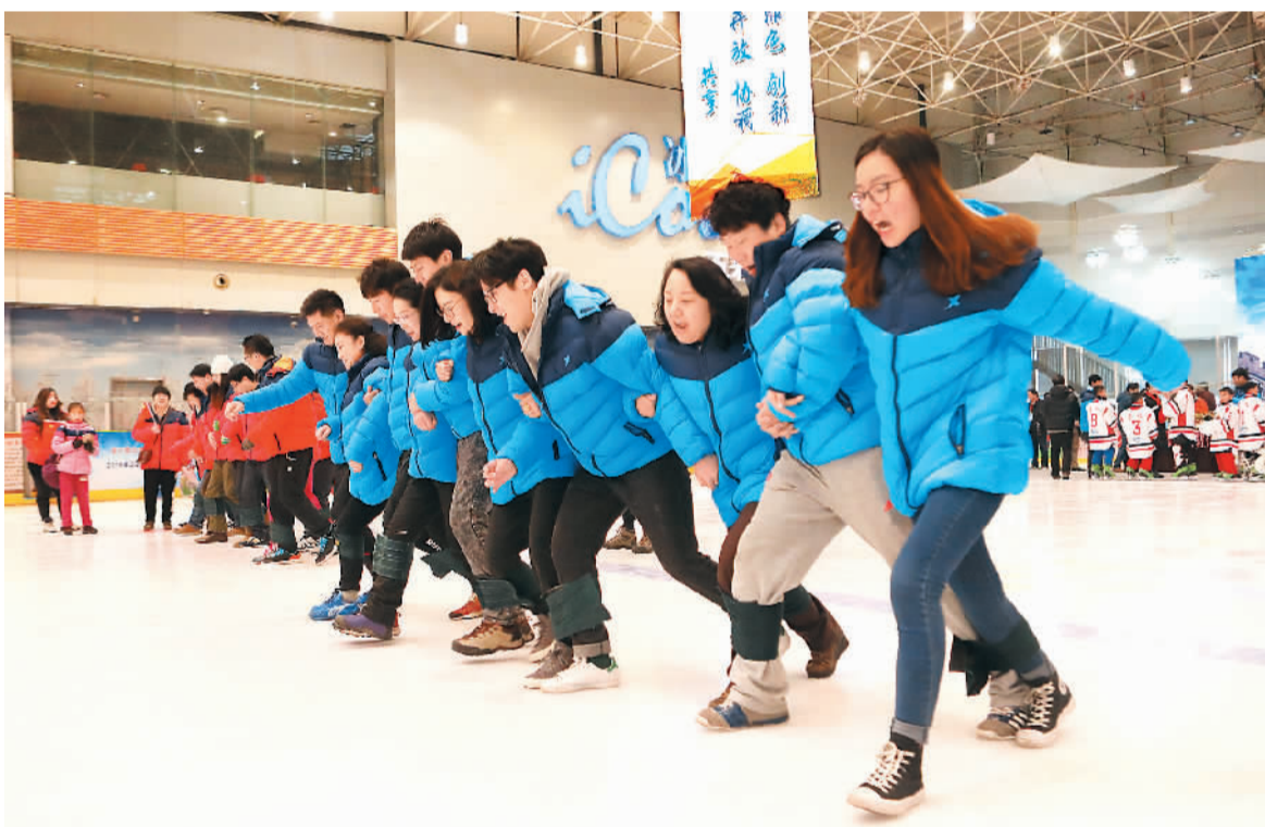
近日,由北京市海淀区体育局、河北省张家口体育局联合主办的第三届北京市民快乐冰雪季暨助力冬奥海淀及张家口冰雪挑战赛(海淀站)活动举办,来自两地的200多名冰雪运动爱好者参与了冰球、冰上拔河、冰上龙舟等项目的挑战赛,尽享冰雪运动的乐趣。图为在北京市海淀区五彩城冰上运动中心,选手在冰上进行“蛟龙出海”挑战赛。