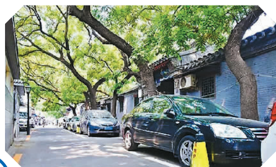
图为引入物业管家的东城区胡同整治、有序。

同时,所有引入物业服务管理的胡同,都采用政府购买服务的方式,完全是政府投入,居民并不需要交纳物业费。