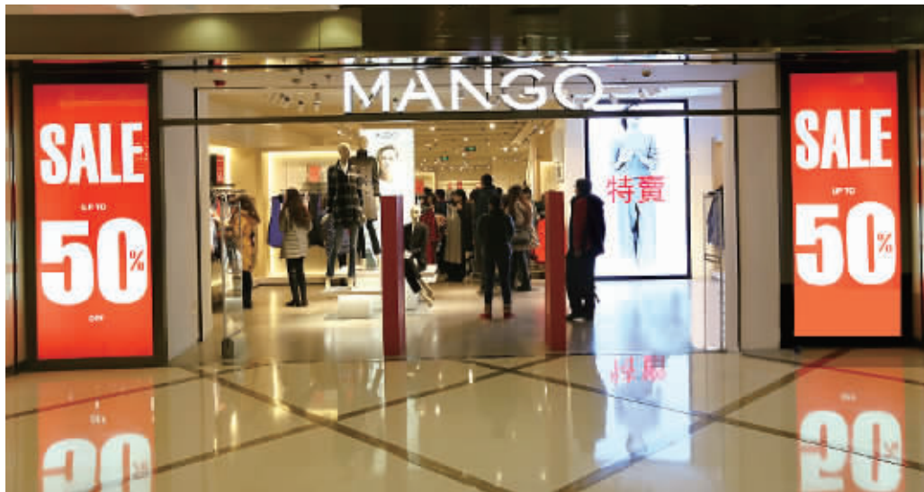
作为首批进驻长沙的西班牙快时尚品牌Mango,如今黯然离场。