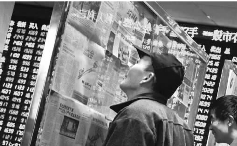
4月26日复牌的3只个股大幅上涨,一度被临时停牌。

4月26日,A股给投资者送上了三份“节日礼物”。*ST朝华、*ST铜城和*ST金城三股恢复上市,开盘后即出现疯涨,一度被深交所临时停牌。其中脱胎换骨后朝华集团因主业变为铅锌矿,盘中一度暴涨达155%,*ST铜城变身的上峰水泥最终上涨67.37%,*ST金城上涨38.39%。