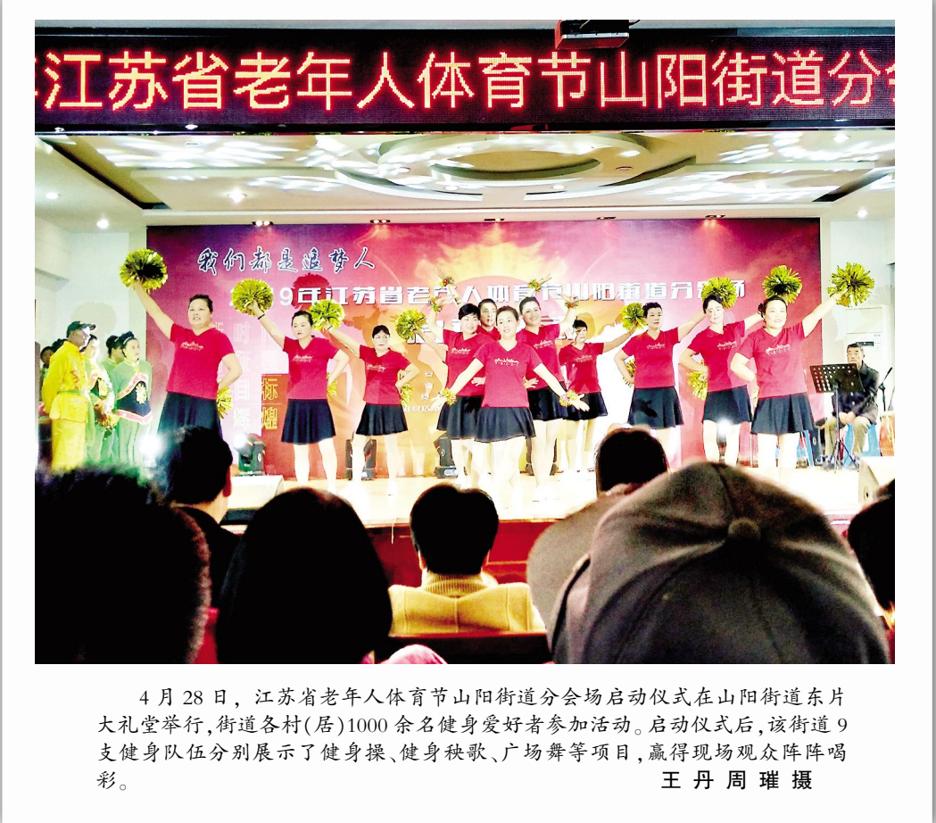
4月28日,江苏省老年人体育节山阳街道分会启动仪式在山阳街道东片大礼堂举行,街道各村(居)1000余名健身爱好者参加活动。启动仪式后,该街道9支健身队伍分别展示了健身操、健身秧歌、广场舞等项目,赢得现场观众阵阵喝彩。

本报讯 我区结合实际情况,采取扎实措施,精准防范和打击非法集资犯罪行为,保护好人民群众财产安全,确保全区社会治安大局和谐稳定。 我区针对不同对象采取针对性的应对措施,对采取暴力胁迫、非法拘禁等非法集资案件坚决打击;对采取传销手段非法集资以及融资、投资名义事传销活动的犯罪,组织区公、检、法机关准确定性,及时立案侦查,依法查处。 我区综合采用现场检查、基层走访、背景调查、社会举报、行业动态掌握、可疑资金分析等措施,对重点行业和领域的高风险或具有重大嫌疑的单位人员以及易受侵害群体开展线索摸排。严格执行“三级”把关制度,做到案件受理、立案、侦查、涉案财物管理逐项环节有人负责、监督,增强案件侦办程序和实体的规范性。 我区通过联席会议、专案走访等形式,加强信息交流,共同制定预防打击措施,强化管控能力,增强打击合力;组织区公安、市监、税务等部门加强对辖区内企业经营活动的监管,对存在非法集资嫌疑的企业及时开展预警调查,发现违法犯罪线索及时上报处置。 (赵年起)