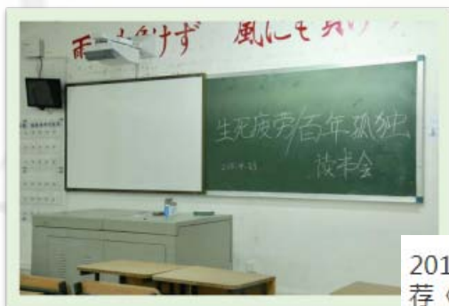
2018第六届读书文化节 | 每月经典推荐《生死疲劳》