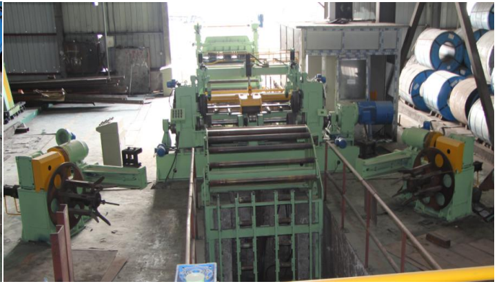
4、精整定尺机、主操台、剪床