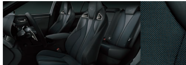
尊爵黑 (Alcantara® 人造麂皮)