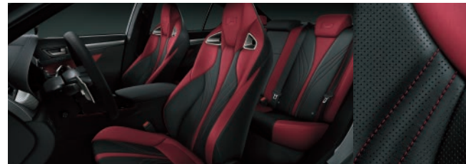
烈焰紅、尊爵黑雙色