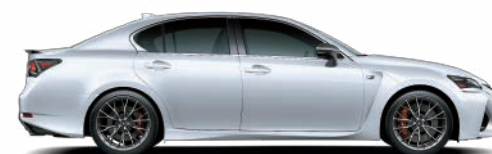
LFA 白 (083)