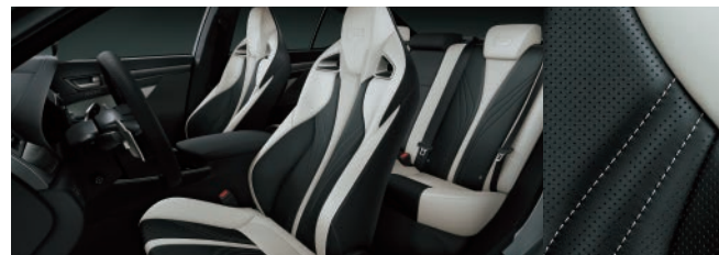
極淨白、尊爵黑雙色

■ 內裝顏色細節依車型版本略有不同，請以實車為準，詳情請參閱官網；本示意圖僅供顏色參考，各車型版本配備請詳閱車型設定配備表。