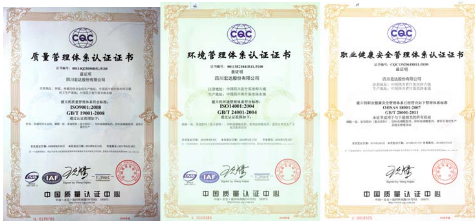
ISO14001/ OHSAS18001/ ISO9001 证书