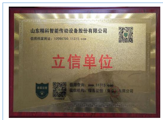
2018年3月，获得“2018年度立信单位”