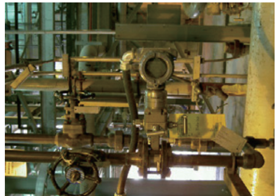
罗斯蒙特差压变送器3051S和紧凑型孔板405P