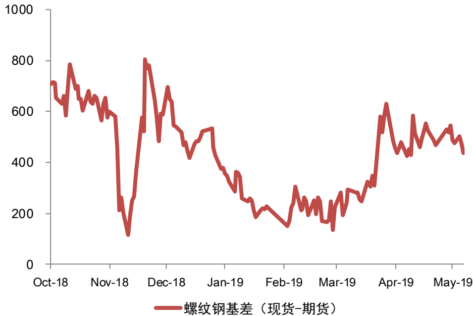
图表：螺纹基差监测