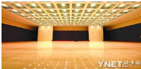
一万平方米大厅没有一根立柱

本报讯 历经近4年的建设，天安门广场东侧的国家博物馆改扩建工程已通过四方验收，将于今天全面竣工，具备开馆迎客条件。记者从承建单位北京城建集团建筑工程总承包部获悉，国家博物馆保留了50年的建筑风貌，在老馆北、西、南三侧原有的外围建筑围合的空地内，建成建筑面积达16万平方米，并与老馆建筑风格协调统一相互连接的新馆。新馆竣工后，与老馆保留的3.5万平方米相加，国家博物馆的总建筑面积达到近20万平方米，成为世界上建筑面积最大的博物馆。