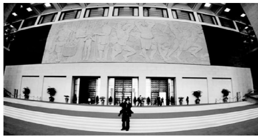
国博新馆的大厅内陈列着一座大型浮雕

本报讯(记者 陈斯)天安门广场东侧的国家博物馆改扩建工程将于明天全面竣工。2月底至3月初开馆试运营。