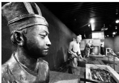
中国文字博物馆内的蔡伦塑像与再现当年蔡伦发明造纸术的场景

1899年，清朝国子监祭酒、金石名家王懿荣的偶然发现，使河南安阳“一片甲骨惊天下”；2009年11月16日，又是河南安阳，中国首座以文字为主题的国家级博物馆中国文字博物馆诞生。中国文字博物馆以出土文字、文物为支撑，荟萃了历代文字样本精华，一馆藏尽中国字令人们一日千年，览尽中国文字从远古“婴儿期”发展至今的非凡历程。