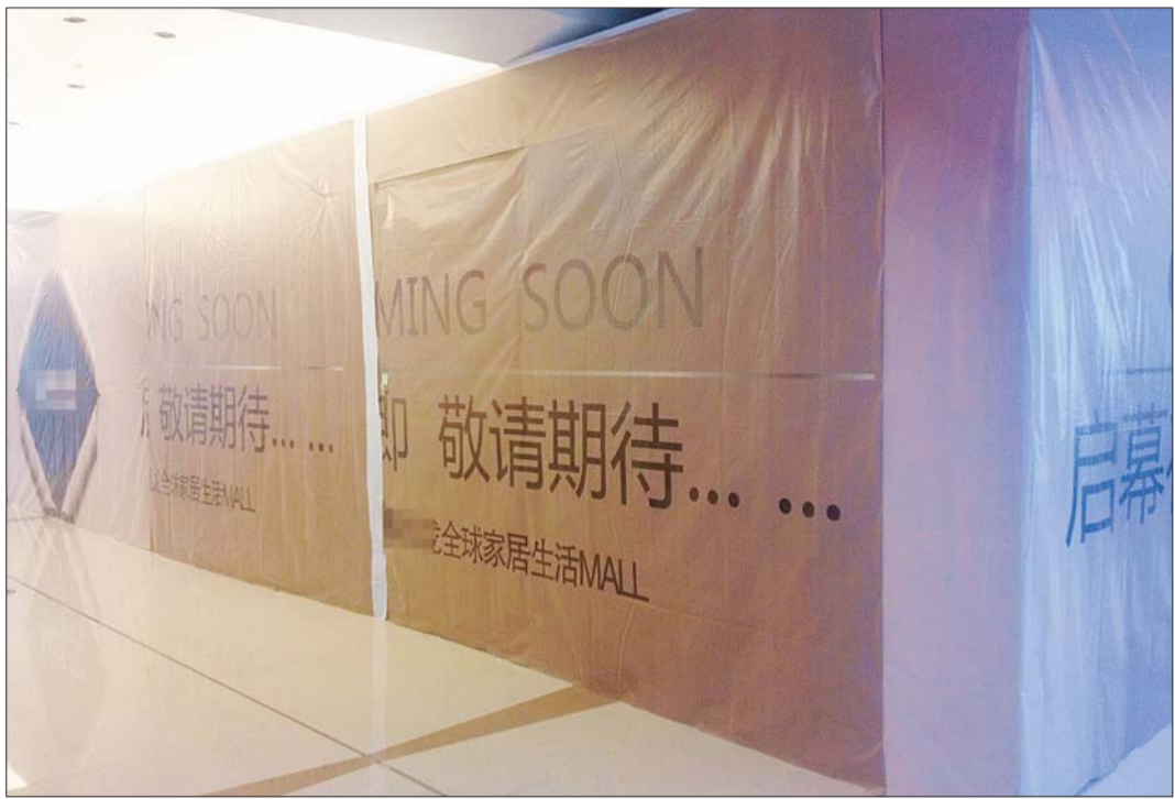
这家店铺已经关门,让不少消费者扑了个空。