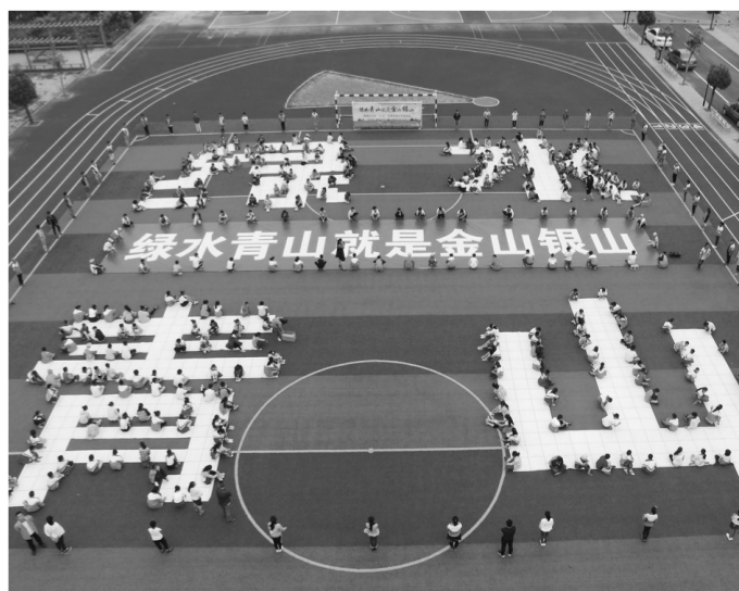
为提高青少年的环境保护意识,枣庄市薛城区围绕“绿水青山就是金山银山”主题,在坛山中心小学举办手绘绿水青山活动。图为小学生在操场上绘画。