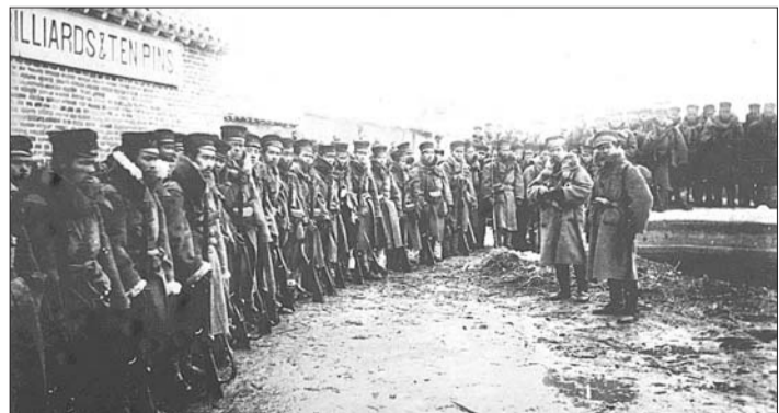
1895年3月7日,日军占领辽宁营口。图为占领营口的日军第一师团。

如果北洋水师不用雁行阵而使用日本舰队的纵列阵型,由于军舰航速快慢不一难以协调,若迁就航速较慢的定镇和舰龄较老的超扬,将拖累整个舰队使得日本舰队利用航速优势占据先机;若使经靖致来四艘快速巡洋舰组成类似日本第一游击队的快速舰队邀击之,则在火力上又不占优势。再考虑到各舰舷侧齐射火力普遍不足,采用单纵队中弹面积更大等因素,损失或许将更多。