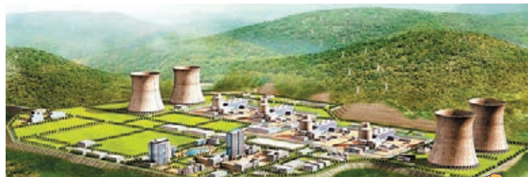
■桃花江核電站效果圖。