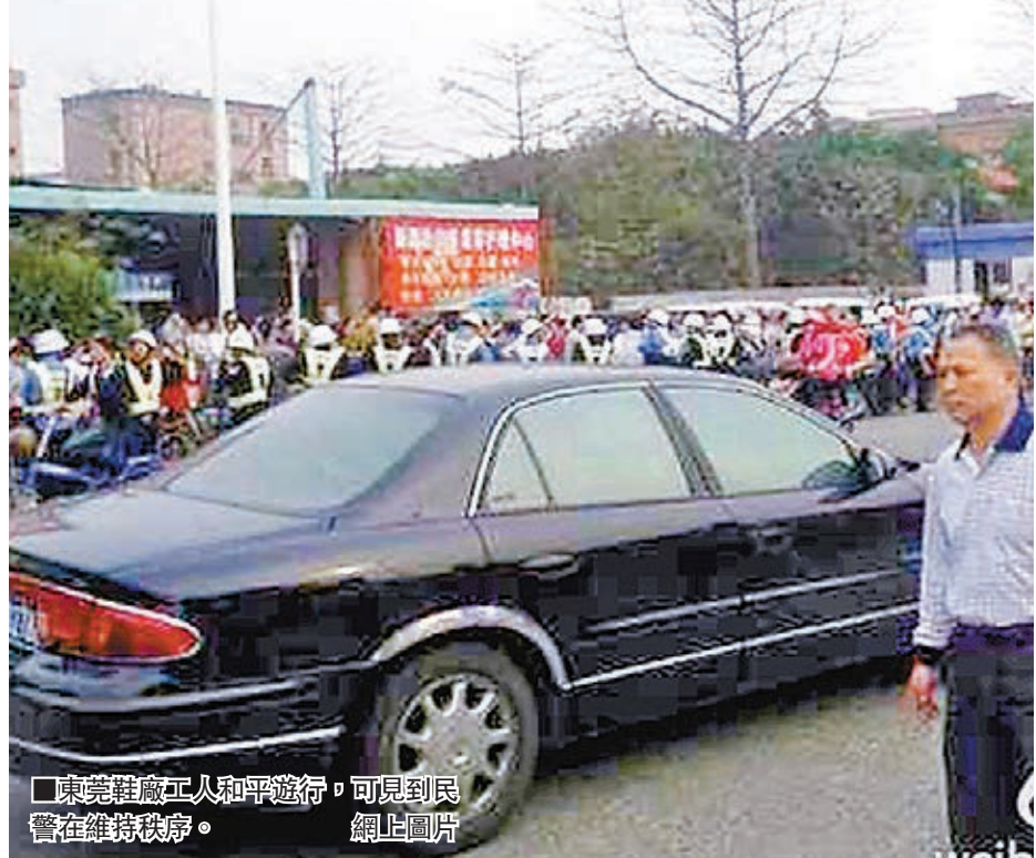
■東莞鞋廠工人和平遊行,可見市民在維持秩序。

香港文匯報訊 據中新社消息:擁有6萬多員工的東莞最大鞋廠——裕元鞋廠,昨天有數千名員工遊行抗議,起因是員工質疑廠方以臨時工標準,為工作十多年的員工購買社保,與員工簽訂無效勞動合同等欺騙行為。據悉,廠方已答應在本月14日給工人一個答覆,目前工廠生產暫未受影響。