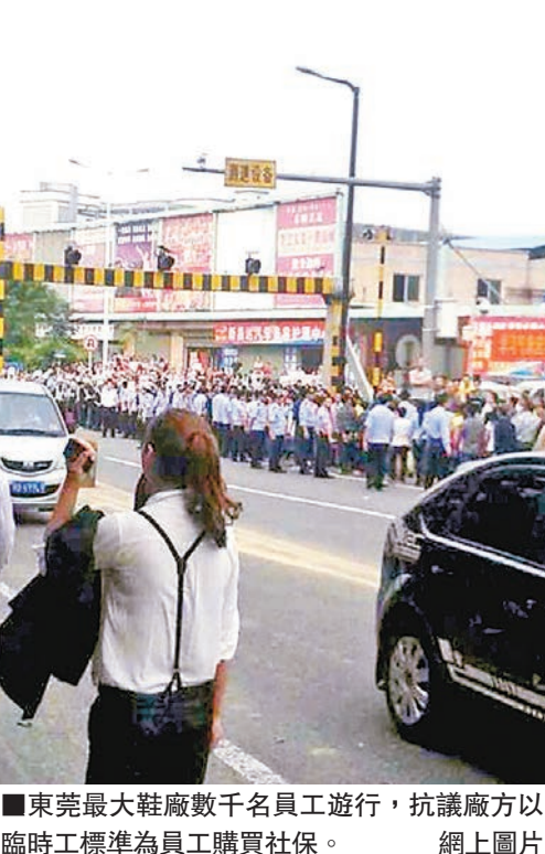
■東莞最大鞋廠數千名員工遊行,抗議廠方以臨時工標準為員工購買社保。

東莞裕元鞋廠隸屬台灣寶成集團,位於東莞市高埗鎮,是耐克、阿迪達斯、REEBOK、SALOMON等世界名牌運動鞋的最大的生產基地。該廠從1988年在東莞市高埗鎮投資設廠以來,目前已形成多個廠區,員工達6萬多人,為全球30多家著名品牌鞋類產品公司進行代工。