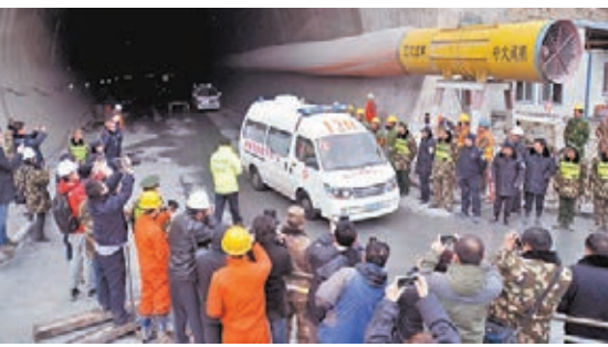
■吉圖琿隧道12名被困人員獲救後被送往醫院。本報吉林傳真

香港文匯報訊(記者張麗利報道)昨日15時20分左右,經過80多個小時多方密切配合、救援,激動人心的消息終於傳來,吉林鐵路隧道塌方事故,吉圖琿客運專線隧道12名被困人員全部獲救,並被立即送往當地醫院進行身體檢查和恢復治療。