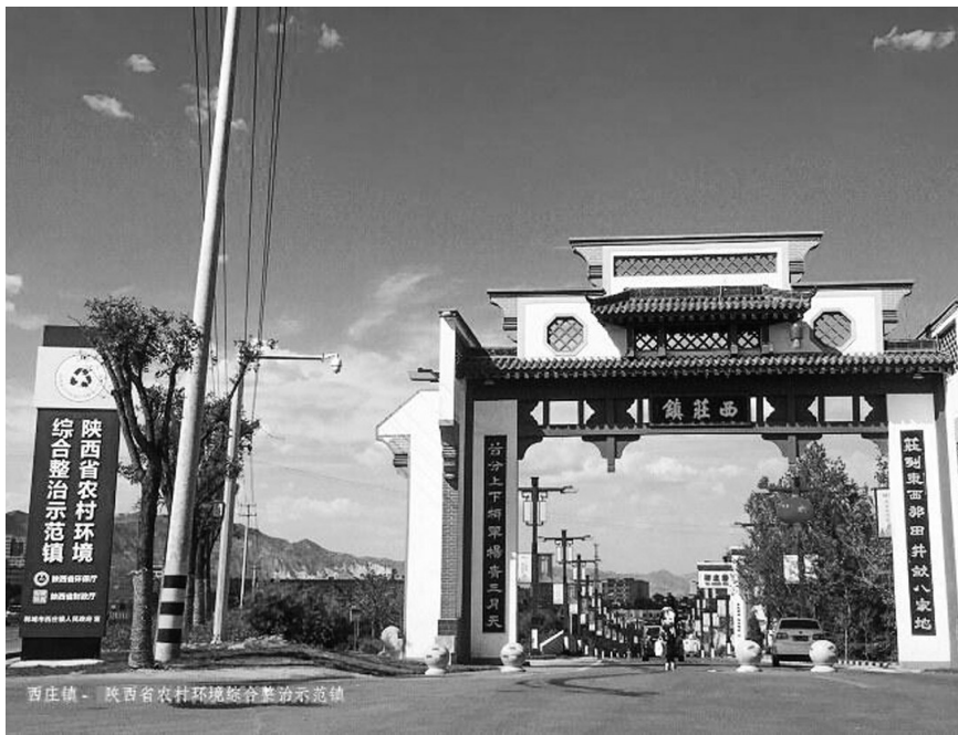
图为陕西省农村环境综合整治示范镇韩城西庄镇。

“五包”制度是韩城市农村环境综合整治工作中的一项制度创新。“五包”即:包抓人员包镇、村、组环境综合整治的督察;包平安建设的推进;包新农村和美丽乡村建设的指导;包产业发展的服务;包政策方针的监督。截至目前,